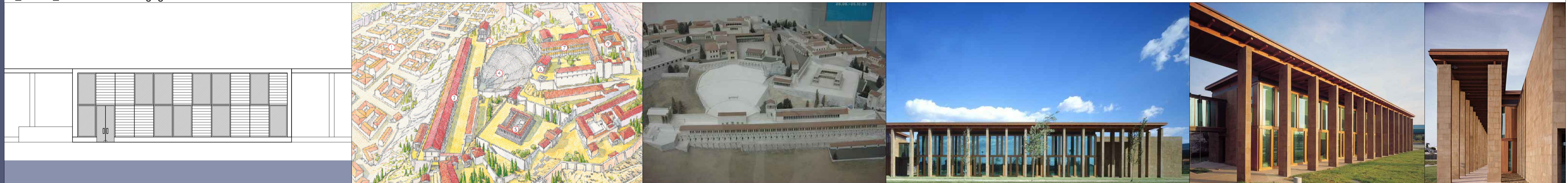
1_Citta' di Pergamo_eta arcaica 2_Firenze_2000_Centro Incontri_Fabrizio Rossi Prodi