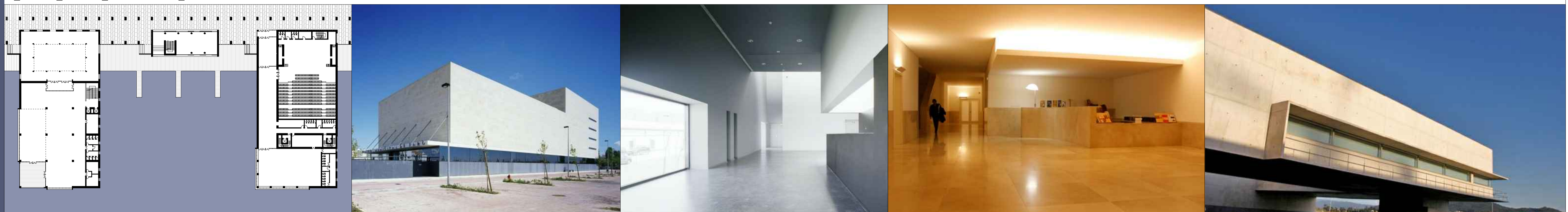
1_Faro_2005_Municipal Theatre_Goncalo Byrne 2_Viana do Castelo_2007_Municipal Library_Alvaro Siza Vieira