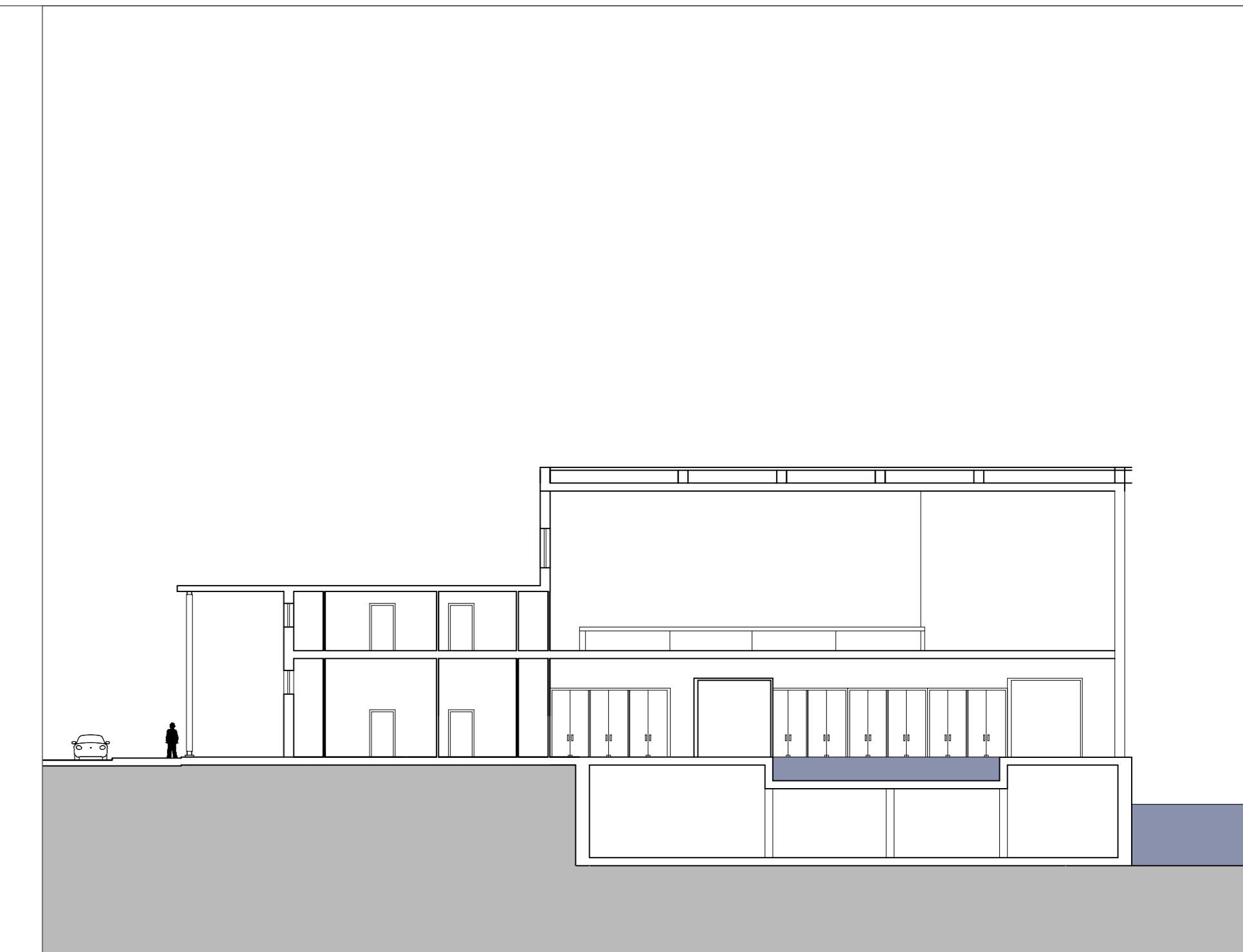
Sezione trasversale CC dell'area termale_scala 1:200