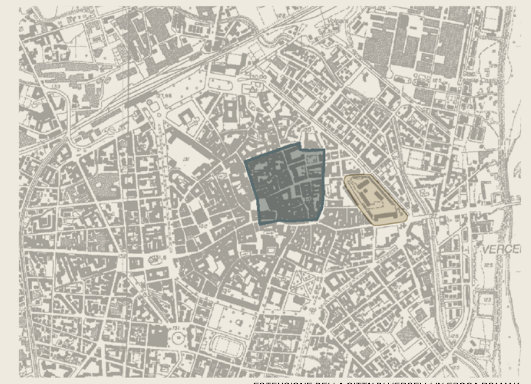
ESTENSIONE DELLA CITTÀ DI VERCELLI IN EPOCA ROMANA