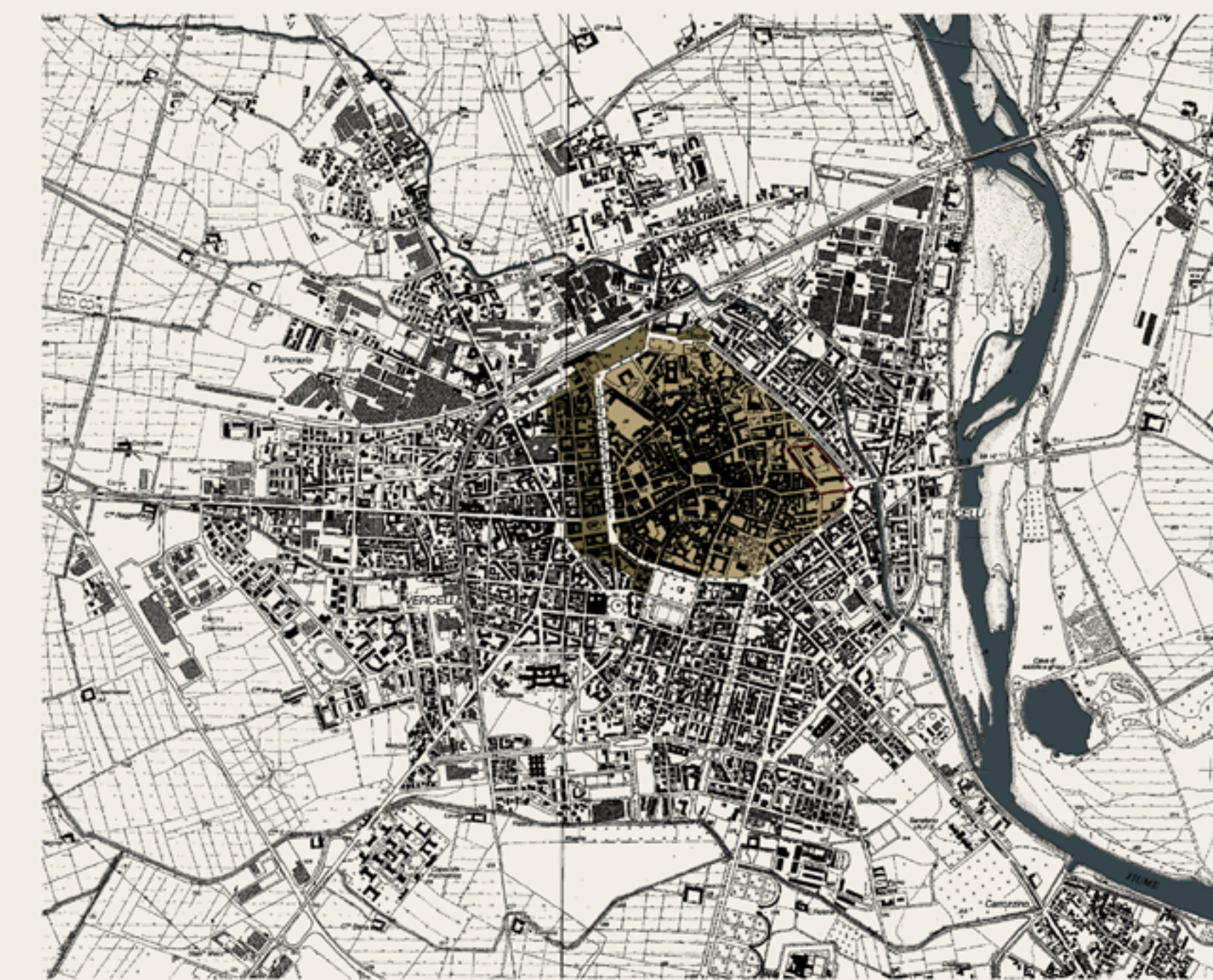
Centro Storico Area Esterna di Espansione PRG 1890