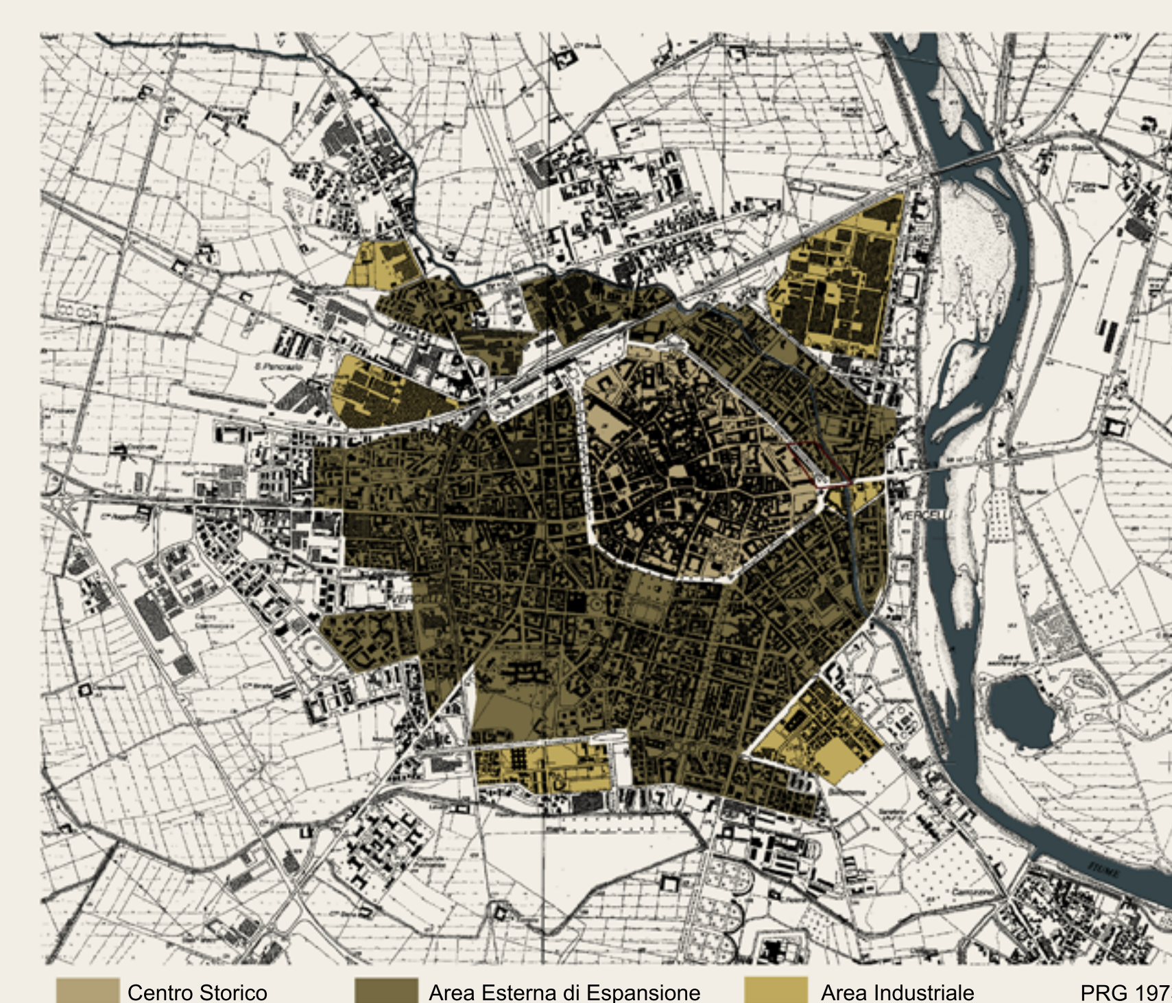
Centro Storico Area Esterna di Espansione Area Industriale PRG 1973