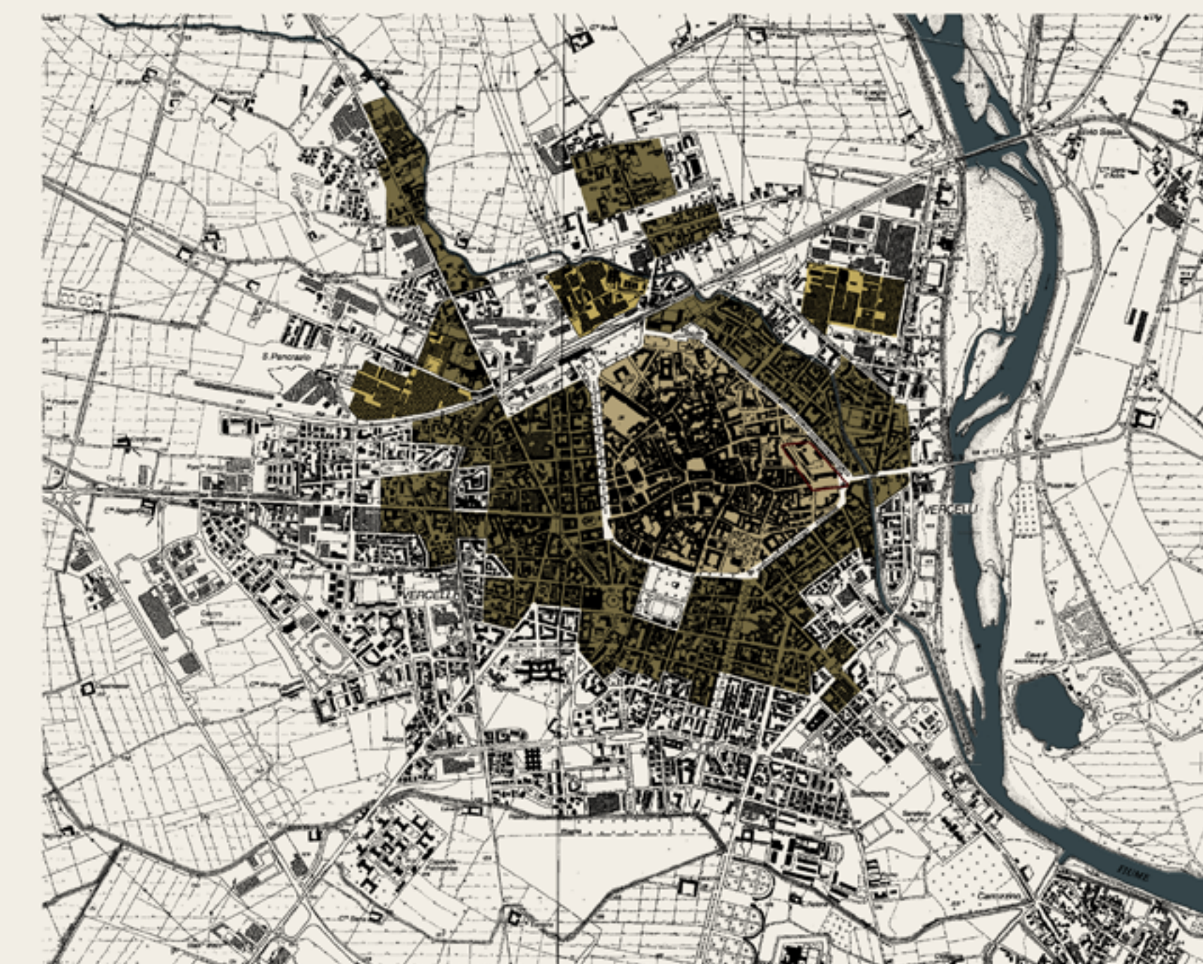
Centro Storico Area Esterna di Espansione Area Industriale PRG 1939