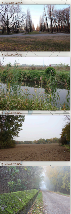
POLITECNICO DI MILANO POLO TERRITORIALE DI MANTOVA SCUOLA DI ARCHITETTURA E SOCIETÀ TESI DI LAUREA MAGISTRALE - A.A. 2011/12