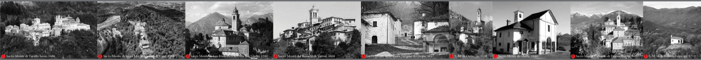
1. Sacro Monte di Varallo Sesia, 1486. 2. Sacro Monte di Santa Maria Assunta di Ceva, 1589. 3. Sacro Monte di San Francesco d'Orta Sili, 1590. 4. Sacro Monte dei Rosari di Varese, 1604. 5. Sacro Monte della Pietà Vergine di Orta, 1617. 6. S. M. di Ostucchio, 1635. 7. Sacro Monte di Ghiffra, 1646. 8. Sacro Monte Carvaro di Domusnovi, 1657. 9. S. M. di Belmonte Valperga, 1712.