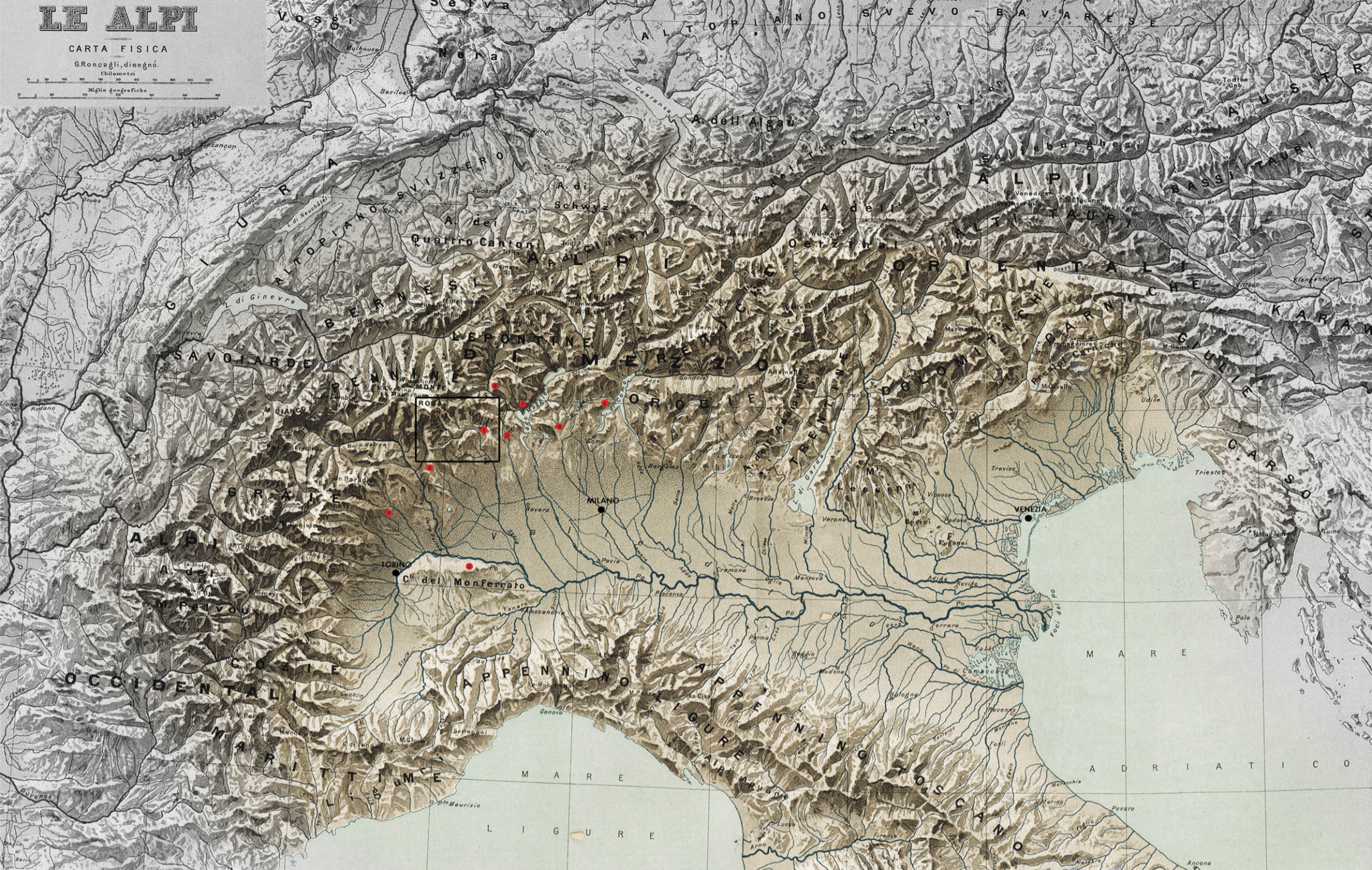
11 nuovi Sacri Monti dell'arco alpino e pre-alpino annoverati nel 2003 nella Lista dei siti del Patrimonio Mondiale dell' UNESCO.