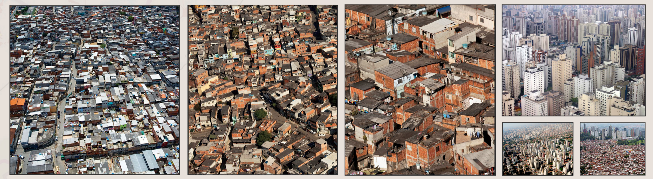
Viste panoramiche di favelas