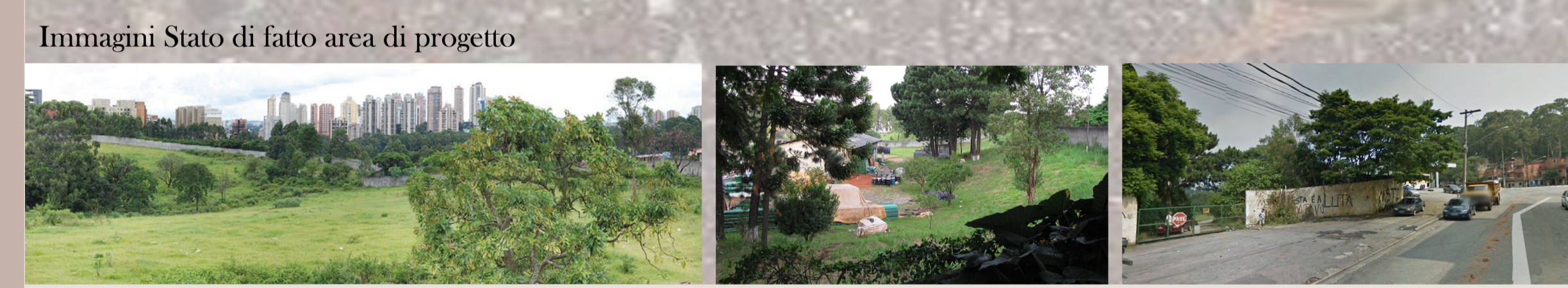
Immagine Stato di fatto area di progetto Vista interna dell'area di progetto dalla via Almirante Delamare Vista dei capannoni industriali esistenti nell'area di progetto Vista dell'unico accesso all'area di progetto dalla Via Licio de Miranda