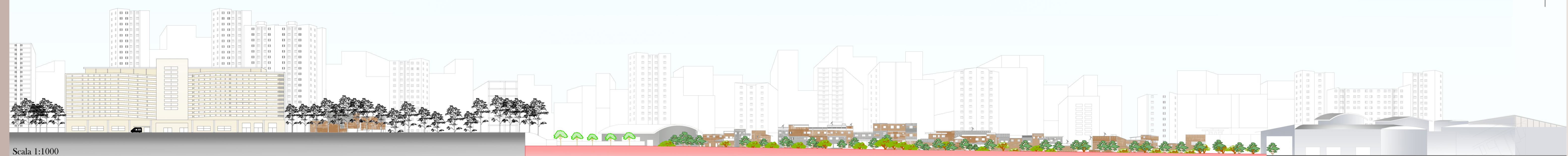
Scala 1:1000 Sezione longitudinale "A_A" Stato di fatto