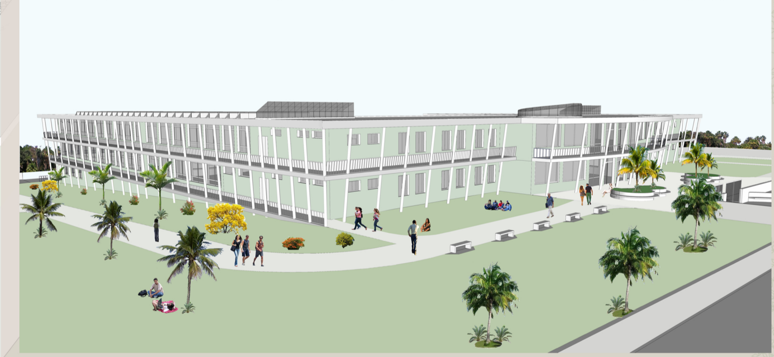
Vista dal piazzale