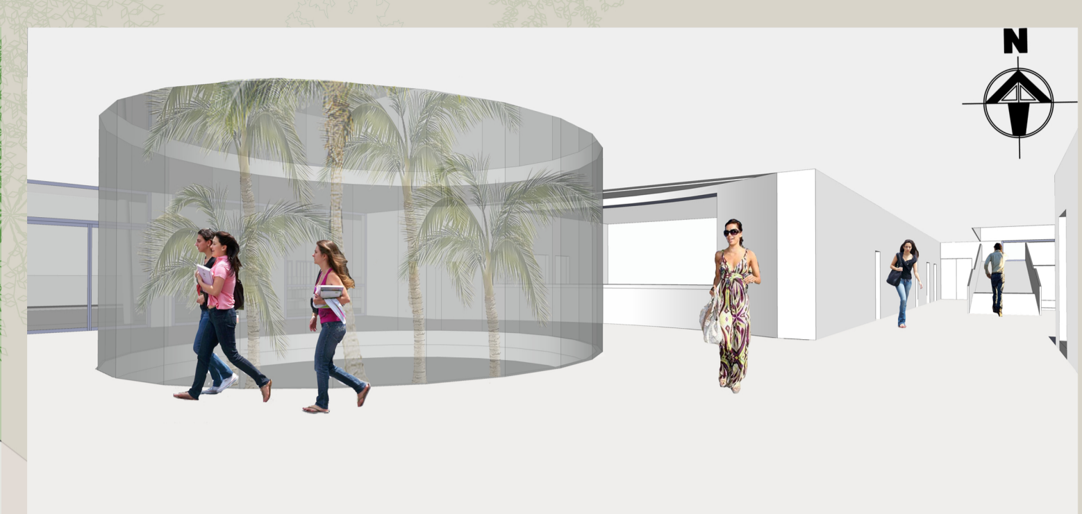
Vista HALL ENTRATA PRINCIPALE - piano terra