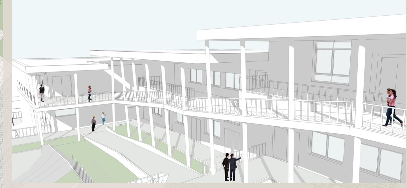
Vista ACCESSO AULE - primo piano