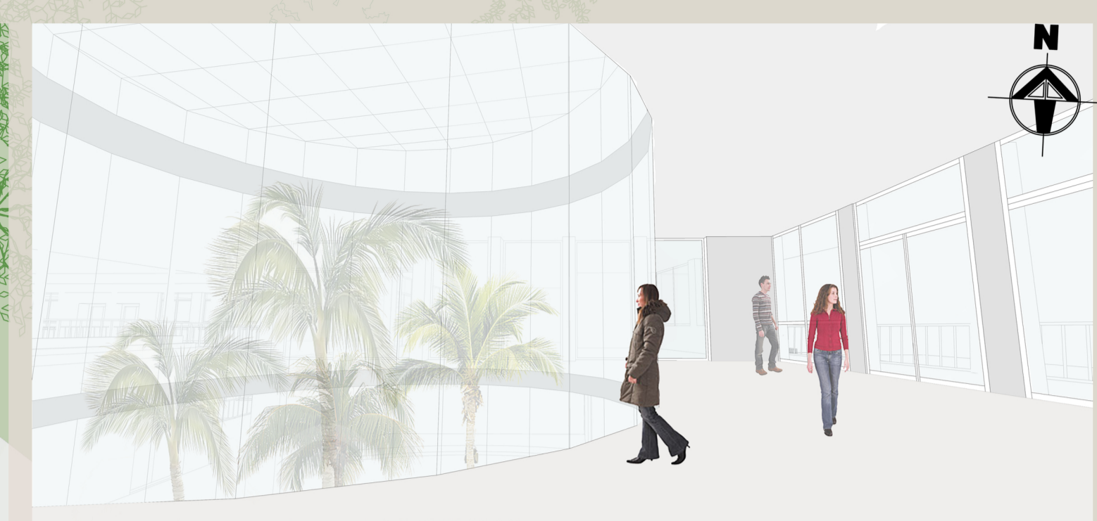
Vista HALL - primo piano