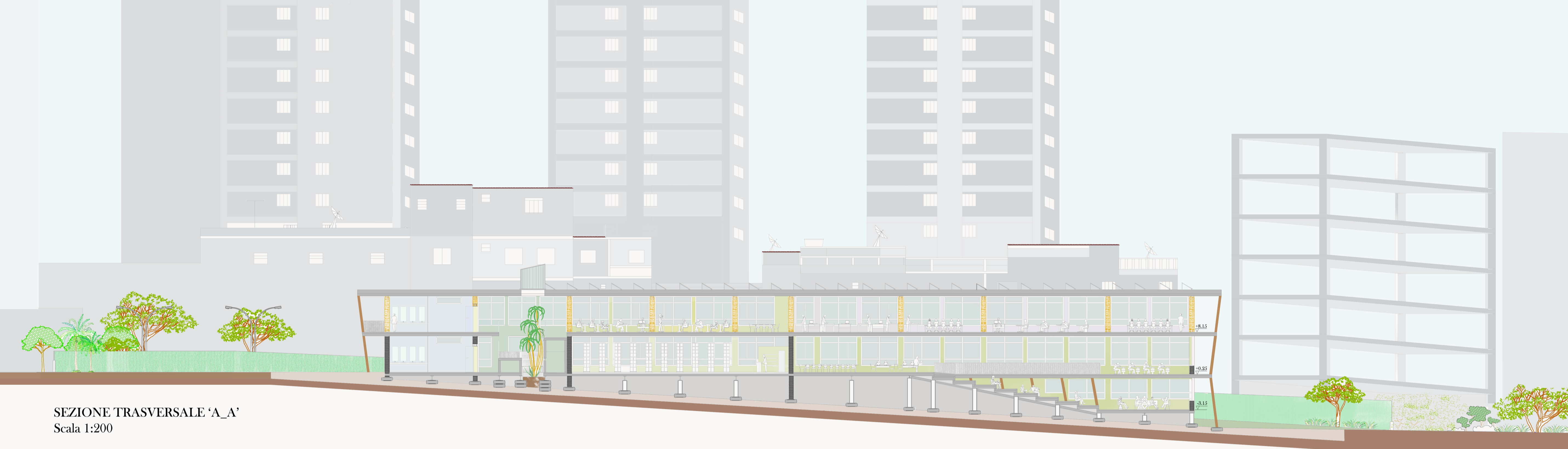
SEZIONE TRASVERSALE 'A_A' Scala 1:200