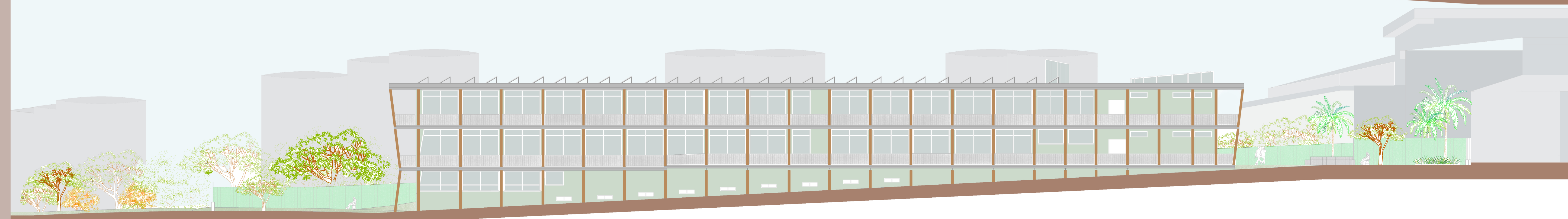
PROSPETTO OVEST Scala 1:200