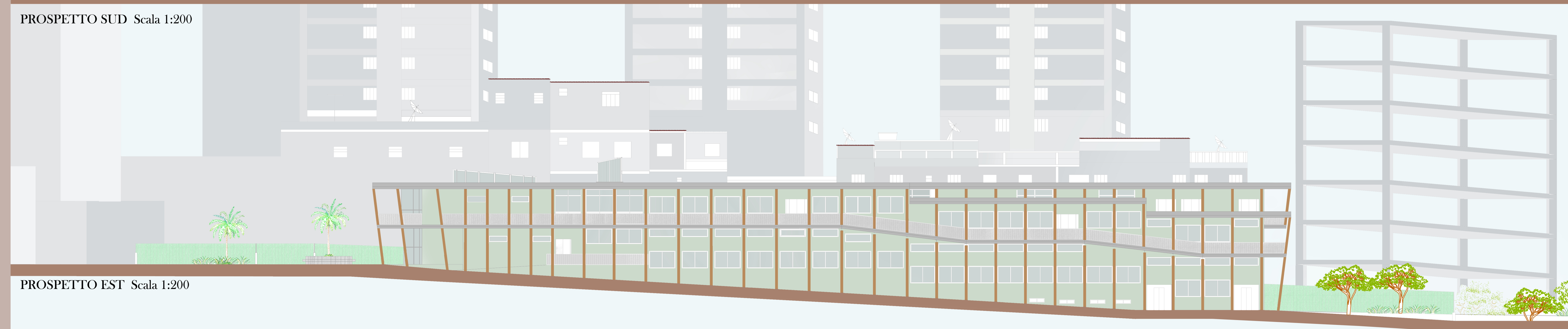
PROSPETTO EST Scala 1:200