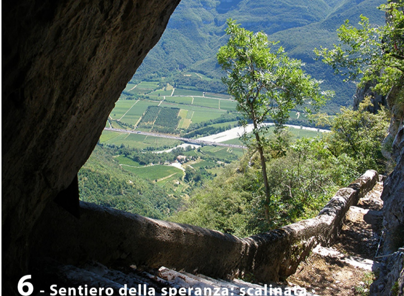
6 - Sentiero della speranza: scalinato