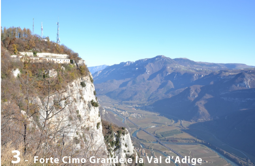
3 - Forte Cimo Grande e la Val d'Adige