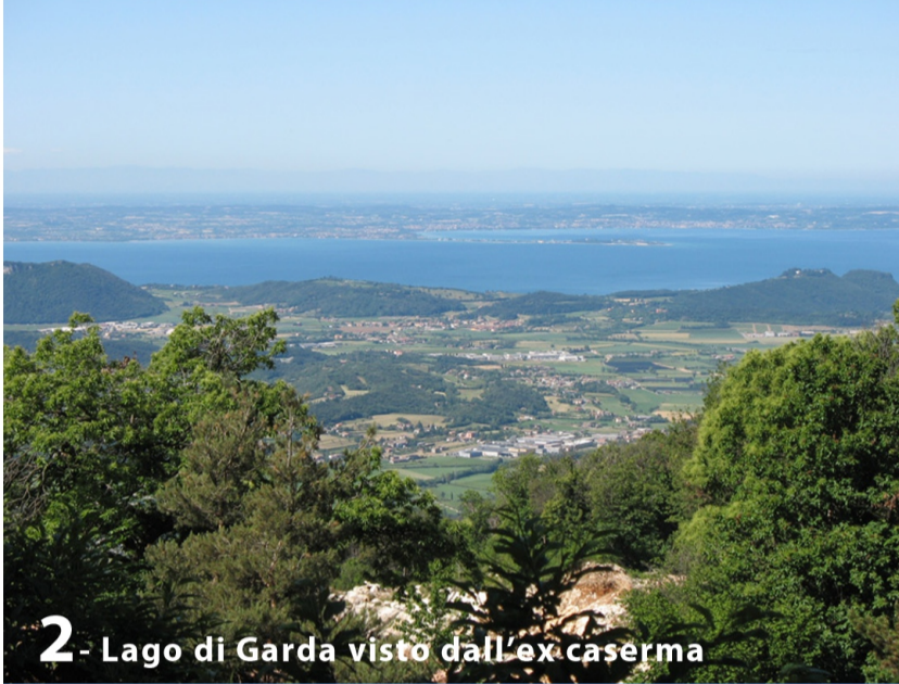
2 - Lago di Garda visto dall'ex caserma