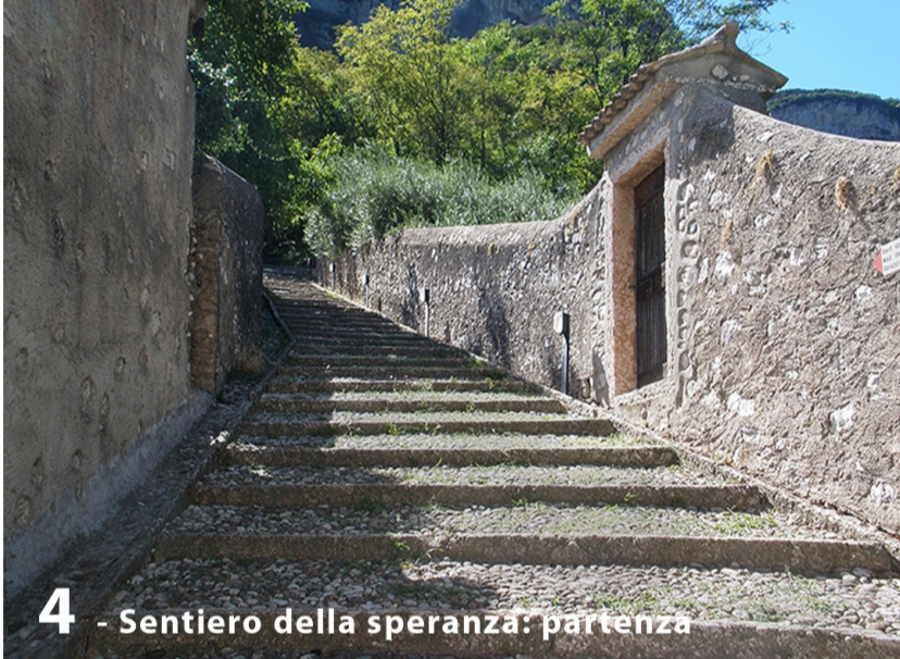
4 - Sentiero della speranza: partenza