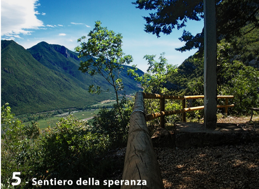
5 - Sentiero della speranza