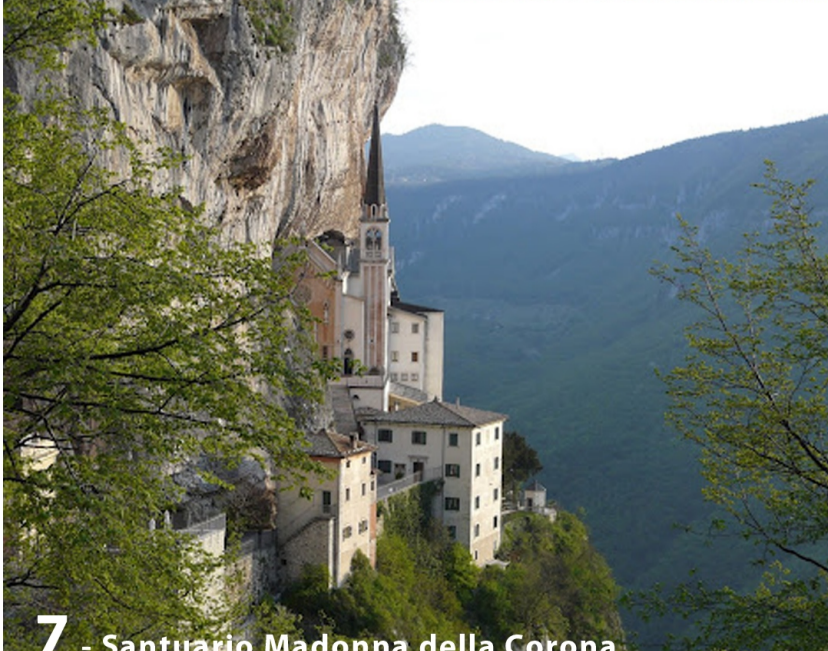
7 - Santuario Madonna della Corona