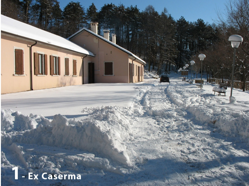
1 - Ex Caserma