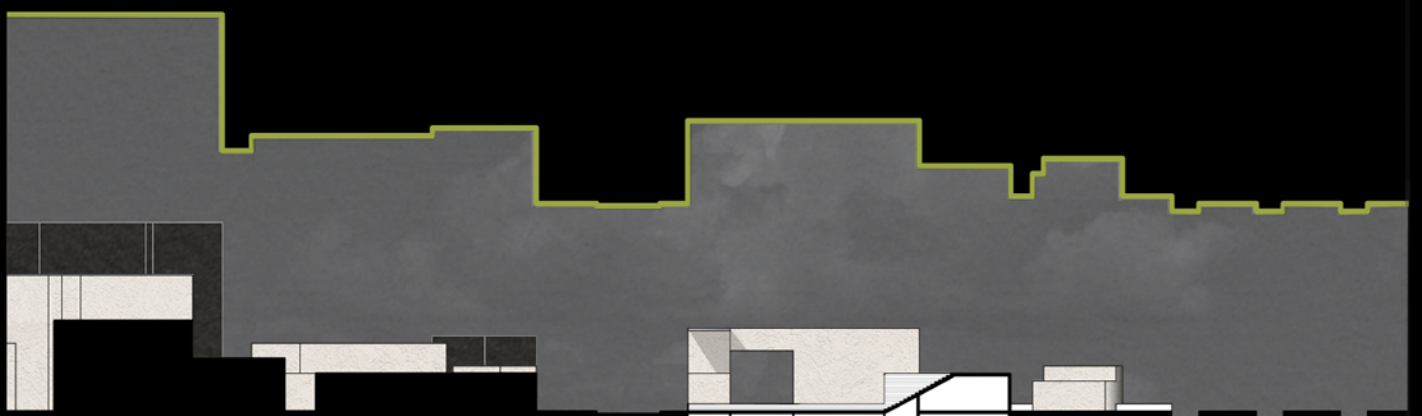
Sezione Section 3-3