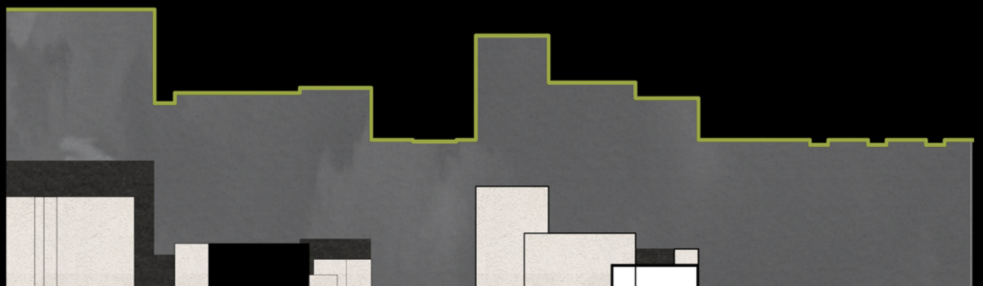
Sezione Section 4-4