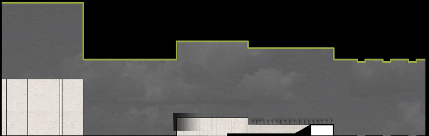
Sezione Section 1-1