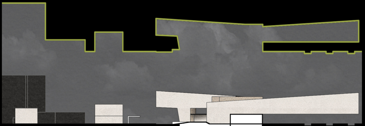
Sezione Section 2-2