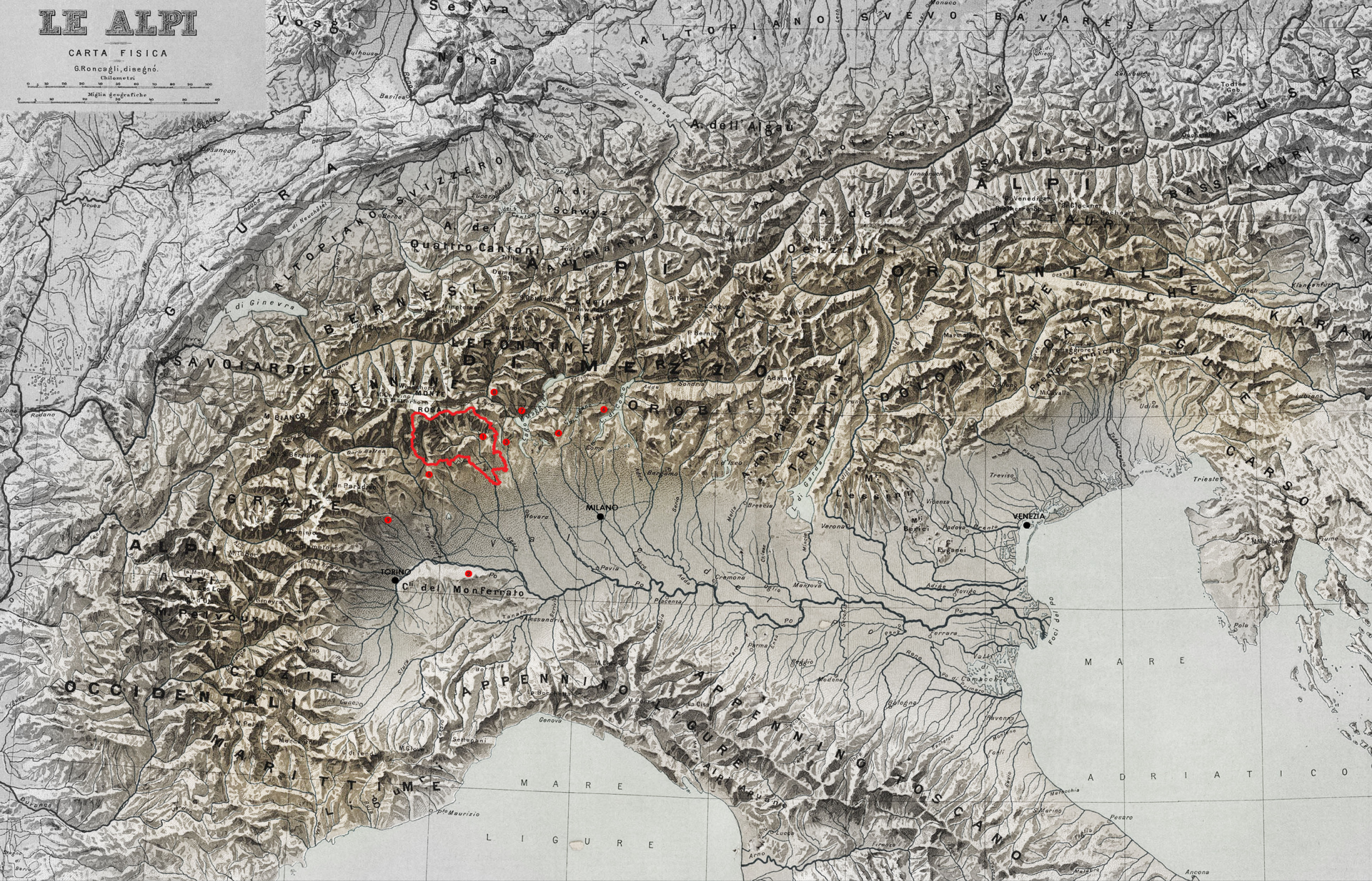
1. I nove Sacri Monti dell'arco alpino e pre-alpino annoverati nel 2003 nella Lista dei siti del Patrimonio Mondiale dell' UNESCO.