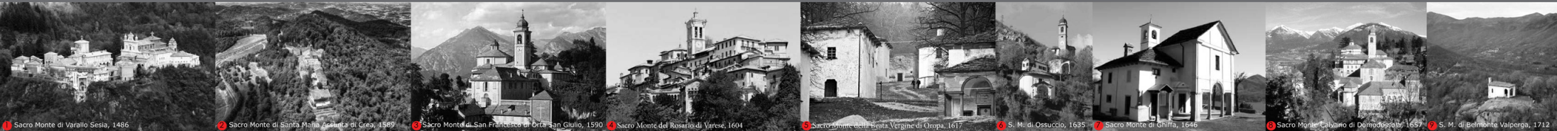
1. Sacro Monte di Varenlo Sesia, 1486. 2. Sacro Monte di Santa Maria Assunta di Greig, 1569. 3. Sacro Monte di San Francesco di Ortica San Giulio, 1590. 4. Sacro Monte del Rosario di Varese, 1604. 5. Sacro Monte della Beata Vergine di Orta, 1617. 6. S. M. di Ossuccio, 1632. 7. Sacro Monte di Ghiffra, 1646. 8. Sacro Monte Cologno di Domogrosso, 1657. 9. S. M. di Belmonte Valperga, 1712.