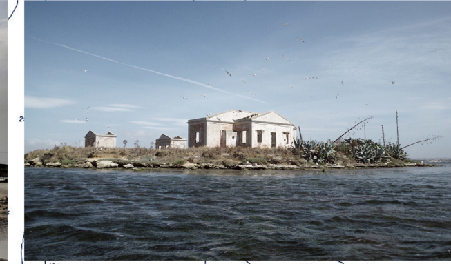
ISOLA MOTHIA_ARCIPELAGO STAGNONE MARSALA