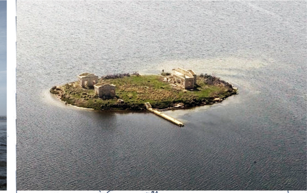
ISOLA MOTHIA_ARCIPELAGO STAGNONE MARSALA