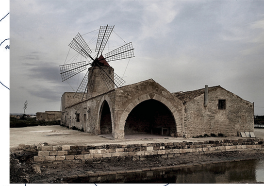
ISOLA SCHOLA_ARCIPELAGO STAGNONE MARSALA