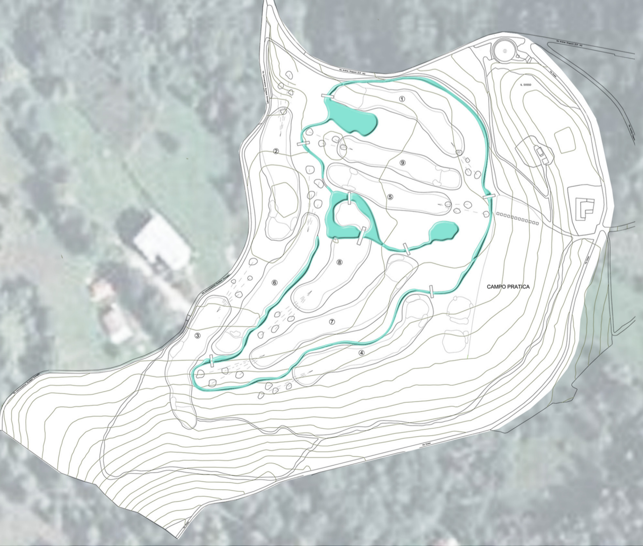
Bacini e corsi d'acqua