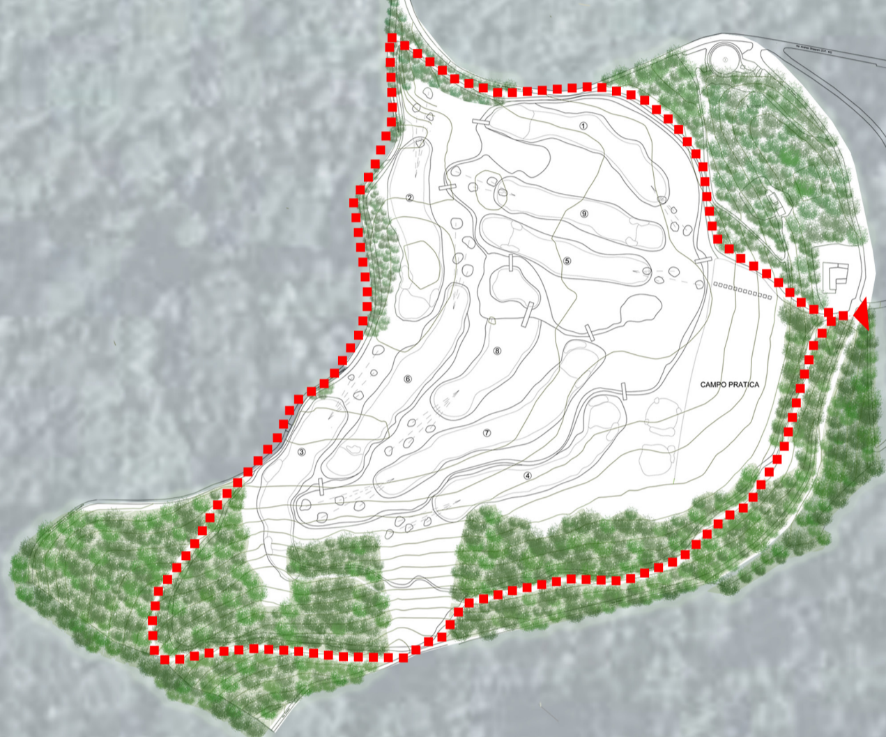
Compensazione alberi abbattuti