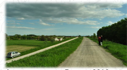
ARGINE MAESTRO, RILIEVO 2012