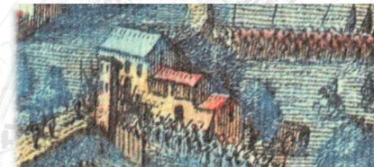
CORTE S. GIUSEPPE, J.HUCHTENBURGH

2. L'ARGINE MAESTRO L'ARGINE MAESTRO ATTUALE FU INNALZATO NEL 1815 A SEGUITO DI UNA DISASTROSA PIENA DEL FIUME; A CAUSA DELLA CONTINUO TRASPORTO ED EROSIONE IL MATERIALE MODIFICA CONTINUAMENTE IL PERCORSO DEL FIUME. AL TEMPO DELLA BATTAGLIA ERA SPOSTATO PIÙ AD OVEST. L'IMPONENZA DI QUESTO MANUFATTO LO RENDE ELEMENTO FORTE NEL TERRITORIO, CREANDO UNA DISCRIMINANTE VISIVA TRA CI CHE È CAMPAGNA COLTIVATA AD EST E CIÒ CHE RIMANE TERRENO GOLENARE FITTO DI PIOPPI AD OVEST. I DUE LUOGHI SONO VISIBILI CONTEMPORANEAMENTE SOLO RECANDOSI SULLA CIMA DELL'ARGINE CHE DETIENE PER CIÒ ANCHE LA FUNZIONE DI PUNTO VISUALE.