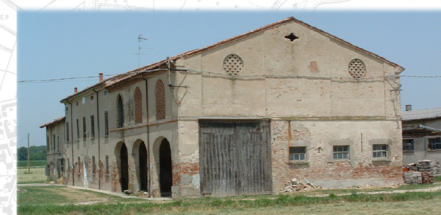
CORTE TANTINE (MONTELAGHI), 2012