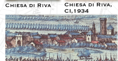
IL PO VECCHIO, HUCHTENBURGH, 1720