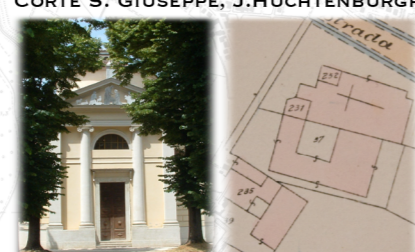
CHIESA DI RIVA, CI, 1934