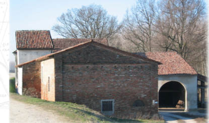
CORTE SAN GIUSEPPE, 2004