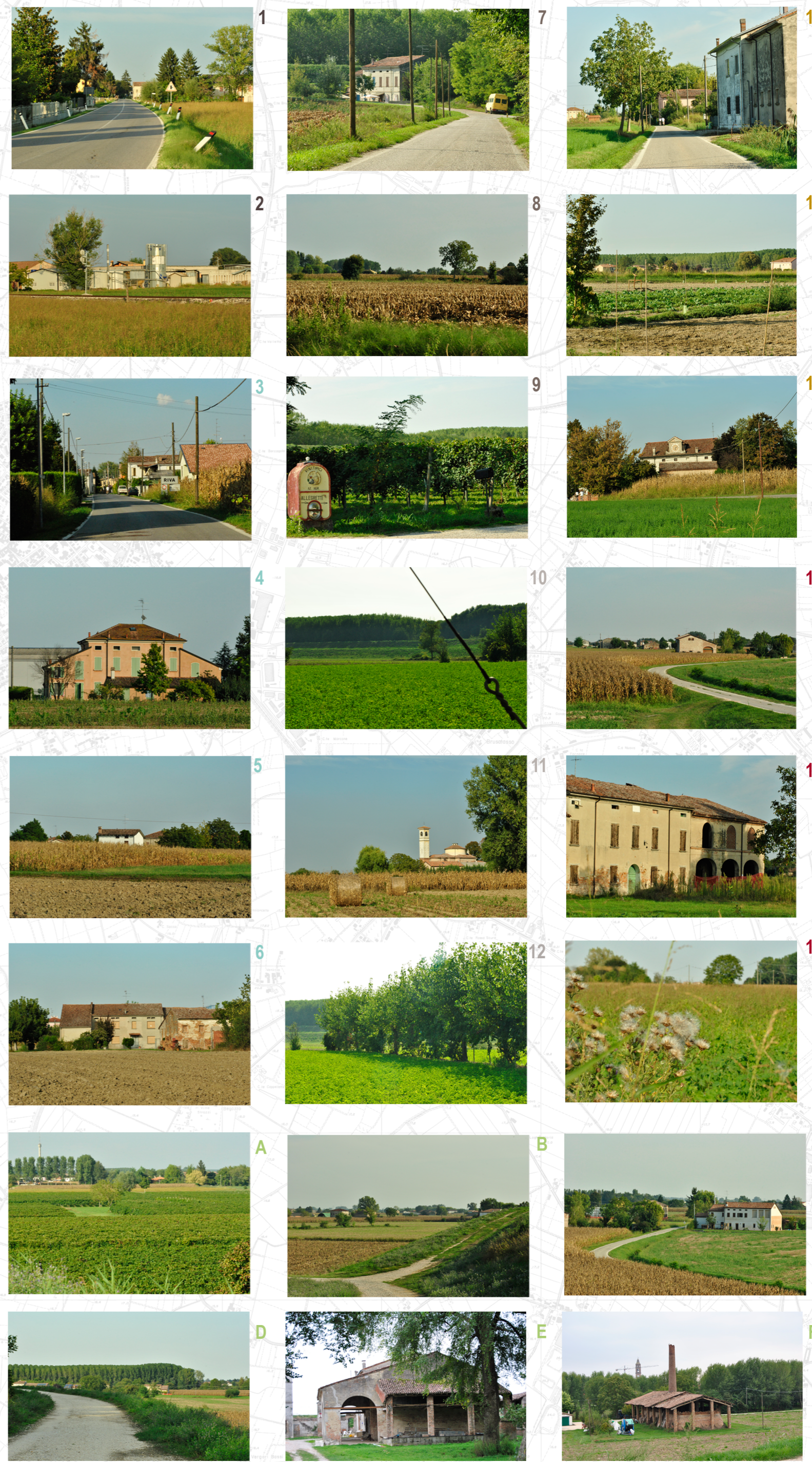
FOTO RILIEVO 8 SETTEMBRE 2012

I VARCHI VISUALI, RILEVATI SECONDO QUANTO SOPRA SCRITTO, SONO INDICATI CON DUE COLORI DIVERSI. QUELLI PIÙ CHIARI SONO QUELLI RIPORTATI DAL PGT, QUELLI PIÙ SCURI SONO QUELLI SEGNATI SECONDO UN RILIEVO DIRETTO A SCALA PIÙ MINUTA. SI È SCELTO DI NON SEGNARE I VARCHI VISUALI DELLA VIABILITÀ LENTA SULLA MAPPA, POICHÈ ESSENDO IL PERCORSO AD UNA QUOTA MOLTO PIÙ ELEVATA RISPETTO AL PIANO DI CAMPAGNA, È OVVIO COME LA VISIBILITÀ DEL PAESAGGIO SI ESTENDA FINO A CHE L'OCCHIO PERCEPISCE.