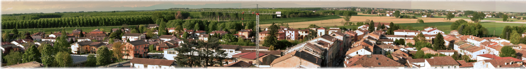
MONTAGGIO IMMAGINI, AREA DELLA BATTAGLIA, RIPRESA DA LA TORRE DI LUZZARA, RILIEVO FOTOGRAFICO 2012