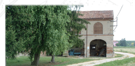
CORTE TANTINE (MONTELAGHI), 2012

1. LA STRADA E LA CORTE TANTINE QUESTI DUE ELEMENTI DI NATURA DIVERSA SONO DA SEMPRE LEGATI TANTO DA ESSERE CHIAMATI CON LO STESSO NOME. SONO ENTRAMBE GIÀ SEGNATE SULLE MAPPE DEL CATASTO TERESIANO (FOGLIO 51). LA CORTE È OTTOCENTESCA E OGGI È LEGATA ANCHE AL NOME DEL PRIMO PROPRIETARIO MONTELAGHI. LA STRADA FU L'ESATTO LUOGO DOVE SI FRONTEGGIARONO I DUE ESERCITI NELLA BATTAGLIA DEL 1702. A CONFERMA DI QUESTA TESI È IL RITROVAMENTO CONTINUO DI MATERIALE BELLICO CHE VIENE ALLA LUCE DURANTE LE ARATURE. LA STRADA È PER UN TRATTO ACCOMPAGNATA DA UN CANALE CHE NE SOTTOLINEA L'IMPORTANZA AI TEMPI DELLA BONIFICA.