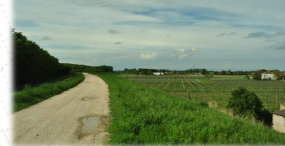
ARGINE MAESTRO, RILIEVO 2012