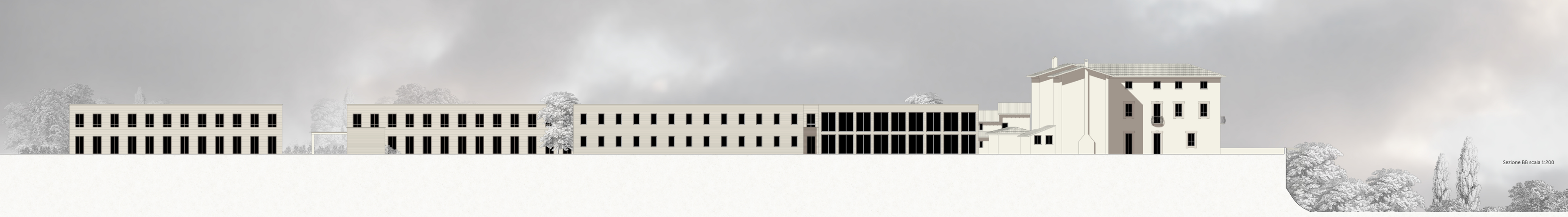
Sezione BB scala 1:200