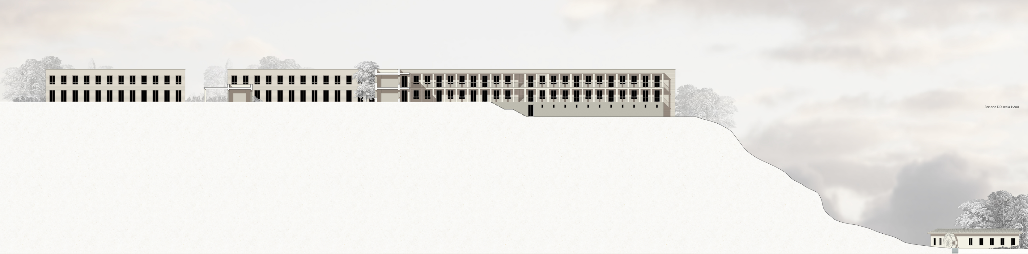
Sezione DD scala 1:200