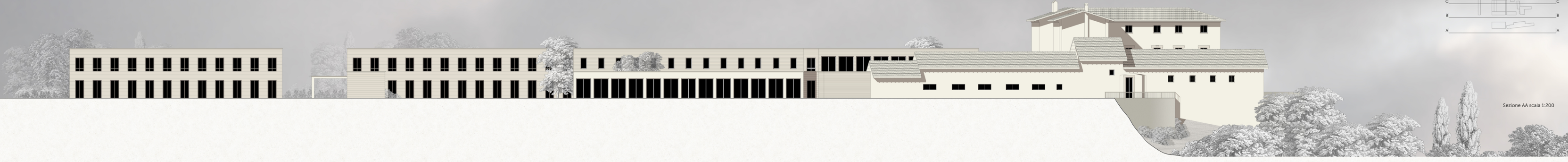
Sezione AA scala 1:200