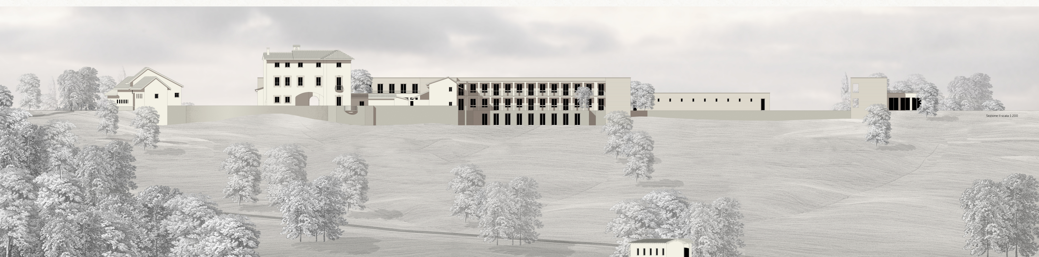
Sezione I scala 1:200