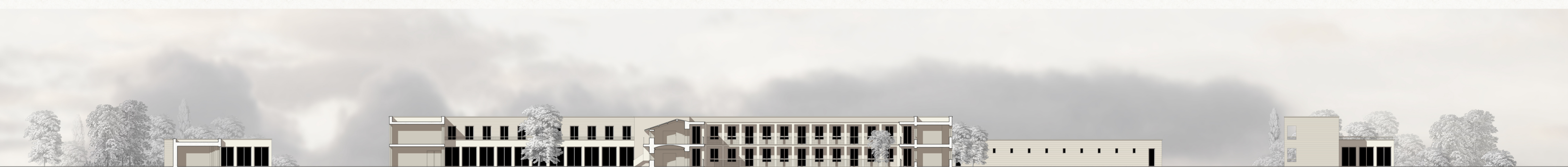
Sezione LL scala 1:200