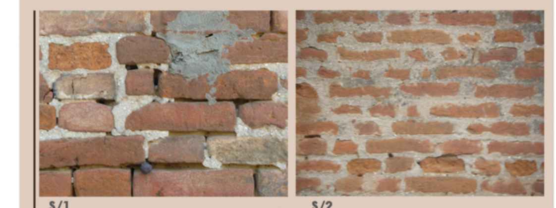
S/1 S/2 sagrestia