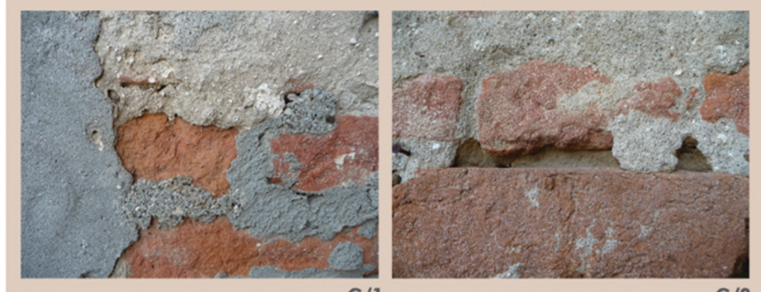
C/1 C/2 casa d'abitazione