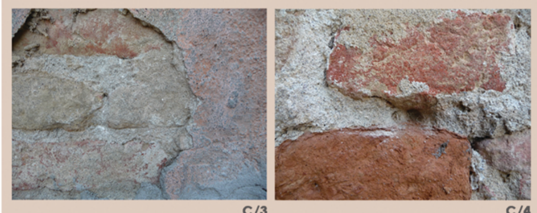
C/3 C/4 casa d'abitazione