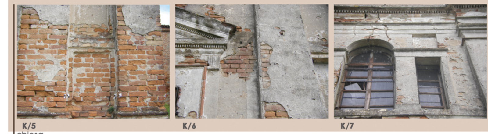
K/5 K/6 K/7 chiesa