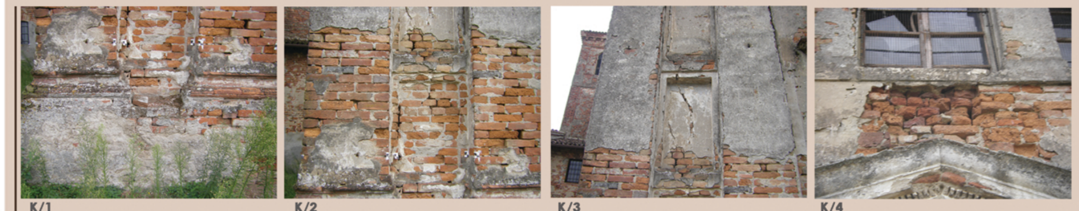
K/1 K/2 K/3 K/4 chiesa