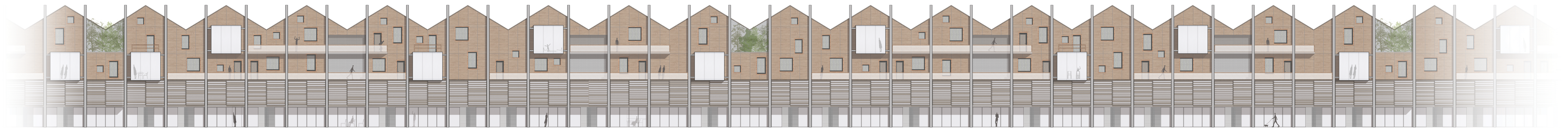
PROSPETTO INTERNO _ UNITÀ ABITATIVE