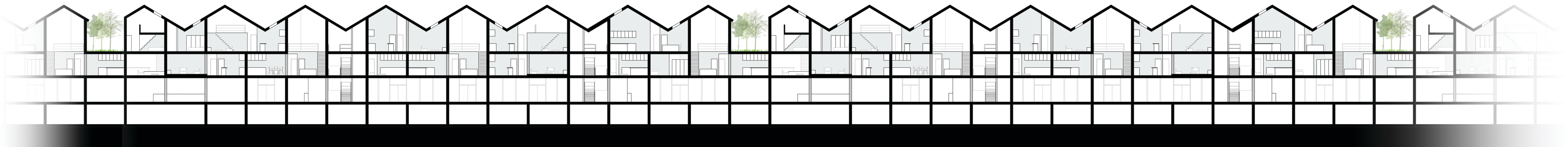
SEZIONE LONGITUDINALE _ UNITÀ ABITATIVE