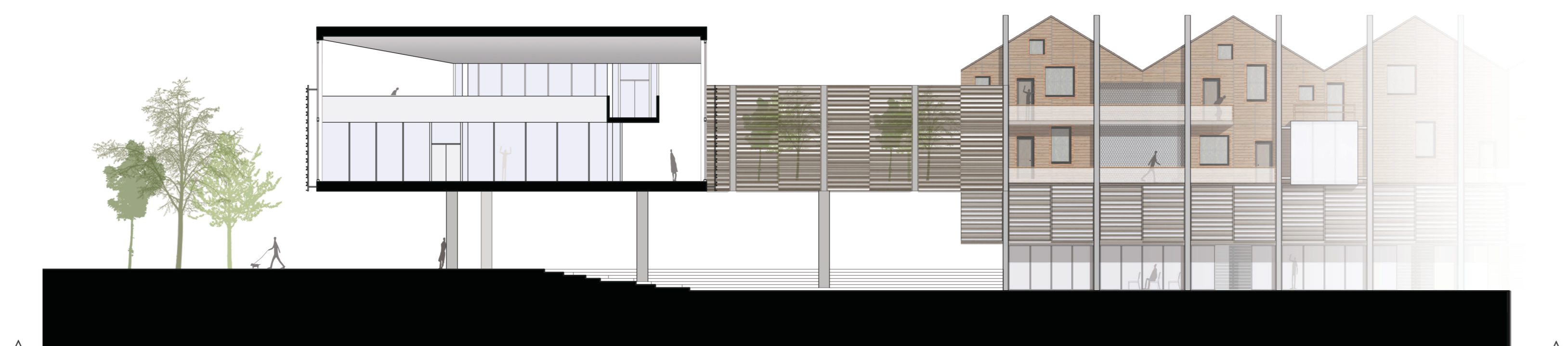
A Sezione Trasversale