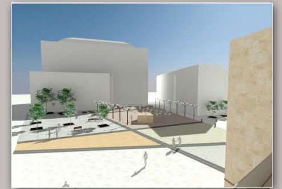
vista dal terrazzo della piazza