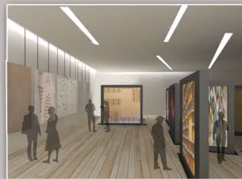
vista secondo piano