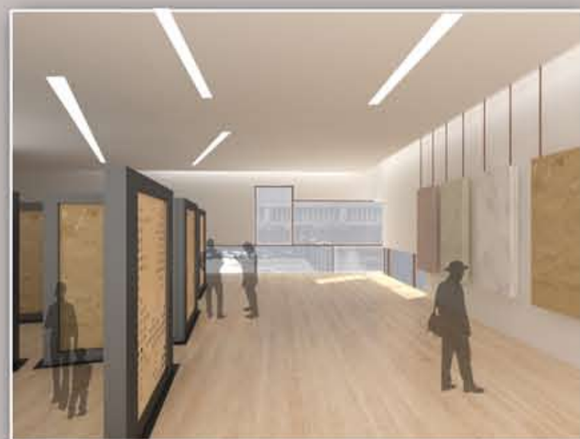
vista primo piano