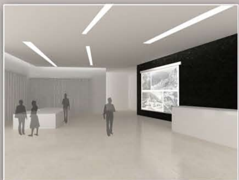
vista piano terra

Nella facciata vengono scolpite su delle lastre metalliche in rilievo delle poesie e celebri frasi dedicati al marmo e in particolare a quello del botticino. Il museo vuole far omaggio non solo al marmo ma anche all' difficile lavoro in cava che affrontano i cava- tori, e per questo che alcune frasi sono dedicati a loro.