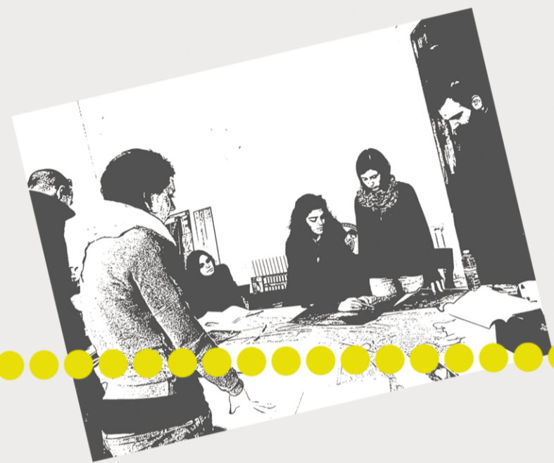
Meeting in municipalità