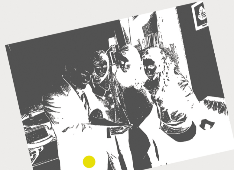
Incontro con il sindaco