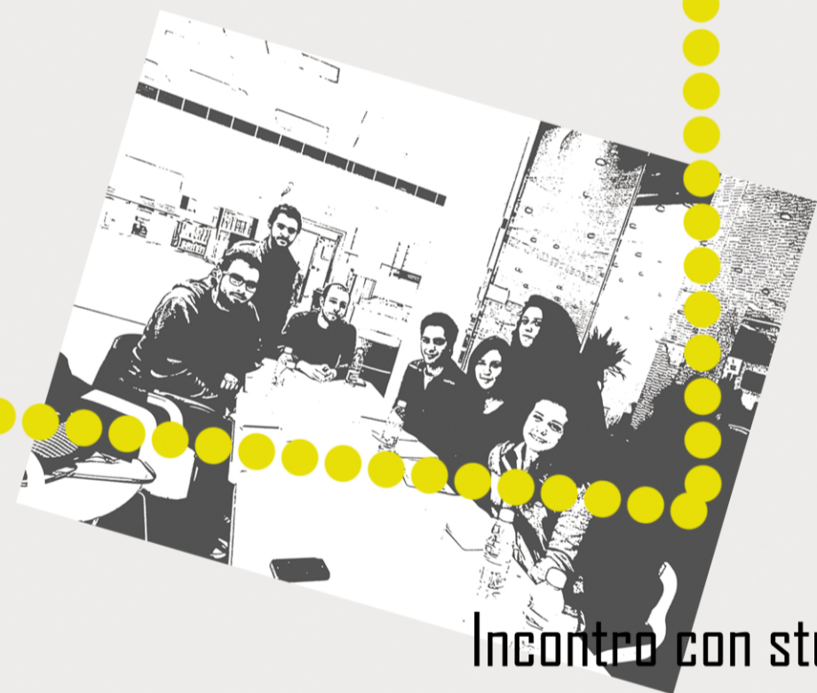
Incontro con studenti