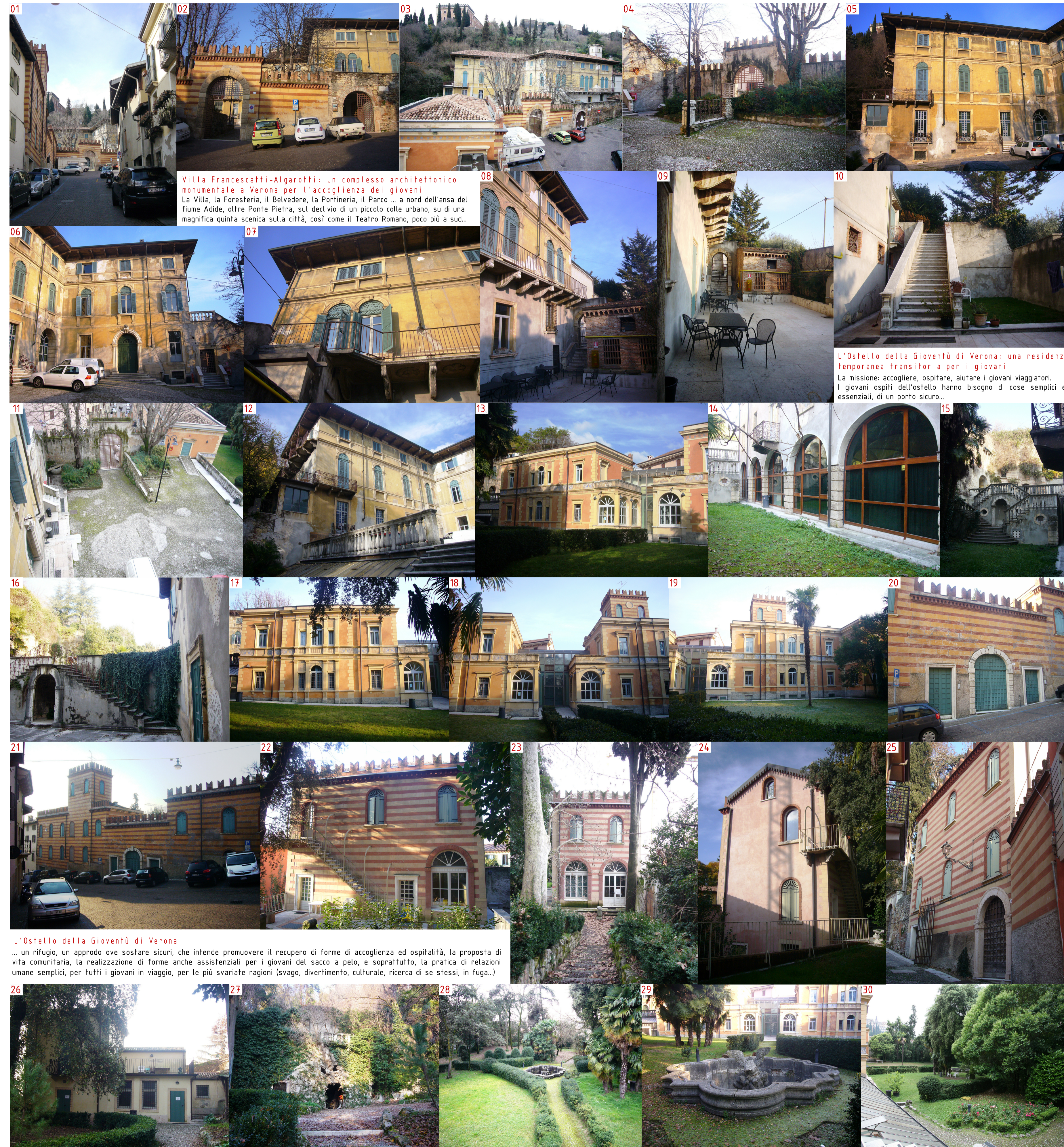
Villa Francescatti-Algarotti: un complesso architettonico monumentale a Verona per l'accoglienza dei giovani La Villa, la Foresteria, il Belvedere, la Portineria, il Parco ... a nord dell'ansa del fiume Adige, oltre Ponte Pietra, sul declivio di un piccolo colle urbano, su di una magnifica quinta scenica sulla città, così come il Teatro Romano, poco più a sud...