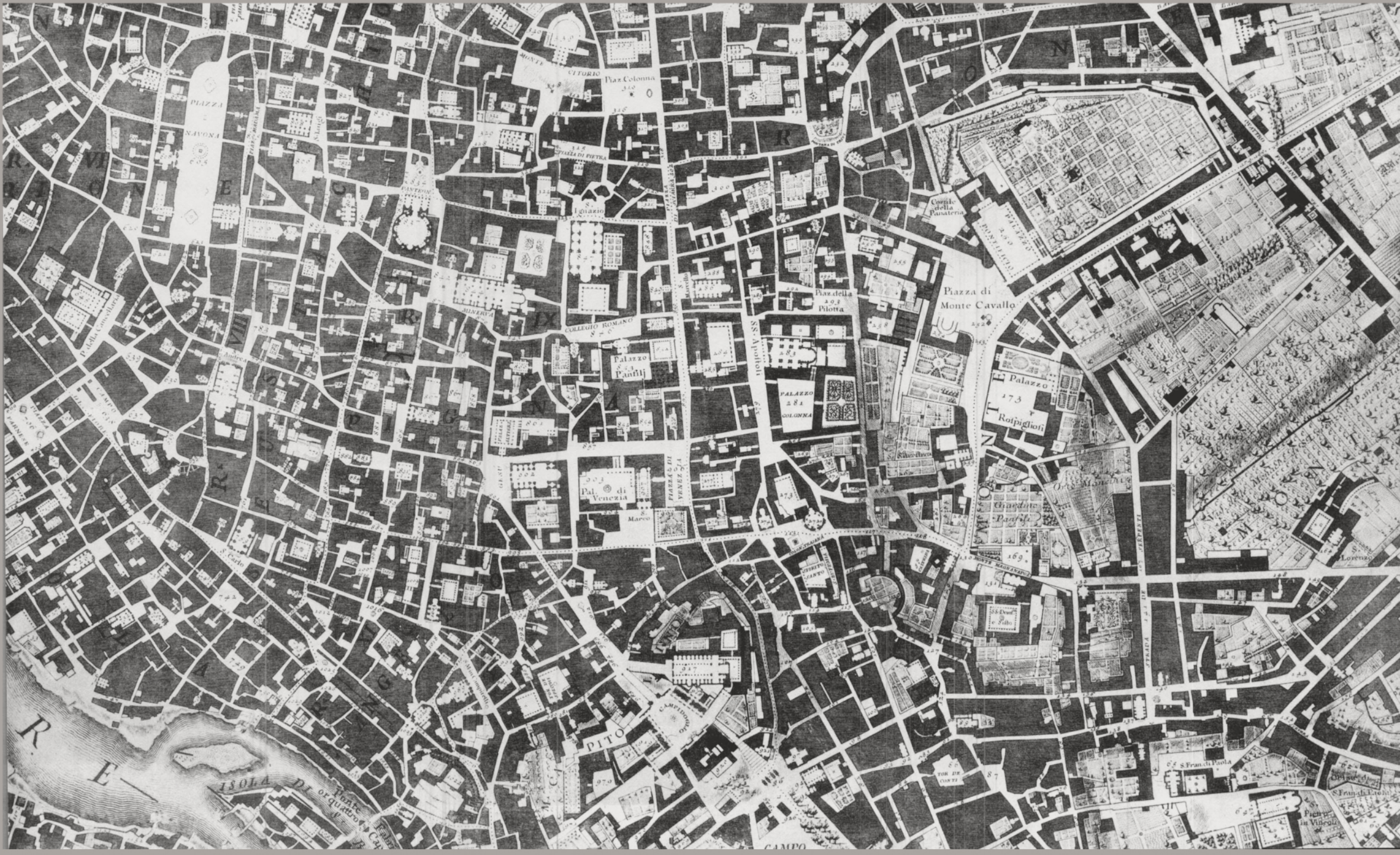
Giovanni Battista Piranesi, 1756