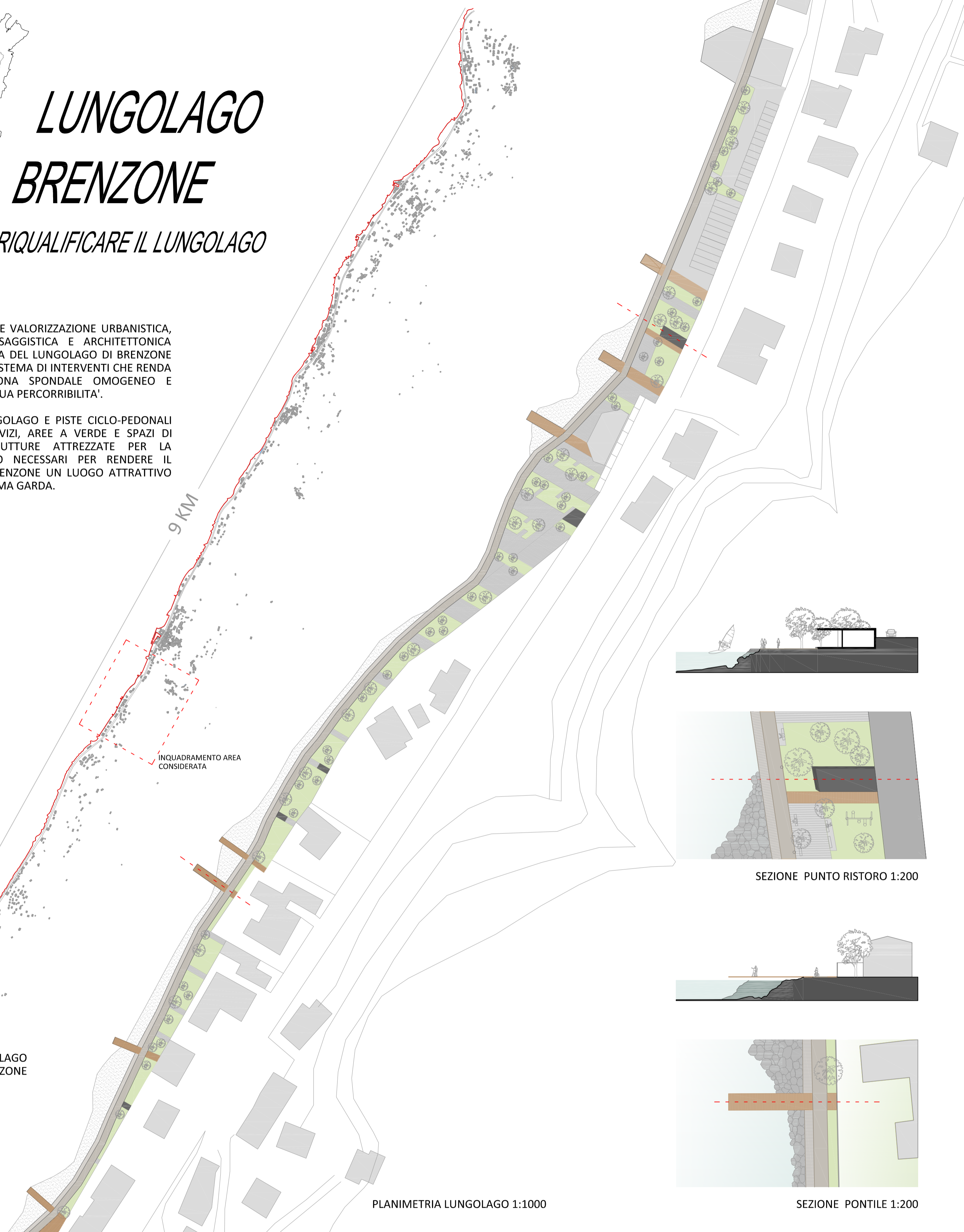
SCHEMA LUNGOLAGO BREZZONE

PASSEGGIATE LUNGOLAGO E PISTE CICLO-PEDONALI CON ANNESSI SERVIZI, AREE A VERDE E SPAZI DI GIOCO CON STRUTTURE ATTREZZATE PER LA RICETTIVITA' SONO NECESSARI PER RENDERE IL LUNGOLAGO DI BREZZONE UN LUOGO ATTRATTIVO PER TUTTO IL SISTEMA GARDA.