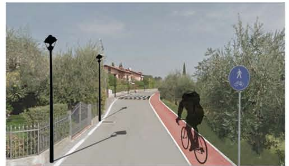
PISTA CICLABILE CHE ATTRAVERSA L'ISOLATO

ANCHE IL VERDE PRIVATO DEVE PARTECIPARE AL MIGLIORAMENTO DELLO SPAZIO URBANO EVITANDO L'UTILIZZO DI RINGHIERE CHE NASCONDONO IL VERDE DEI GIARDINI INTERNI E FAVORENDO UNA VISIONE D'INSIEME DEL VERDE SIA PUBBLICO CHE PRIVATO.