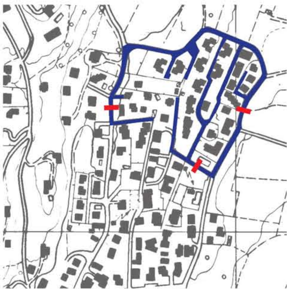
STRADE A RIDOTTO SCORRIMENTO E DOSSI STRADALI