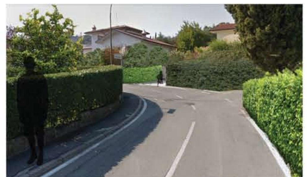
VERDE PRIVATO COME VALORIZZAZIONE DELL'ISOLATO