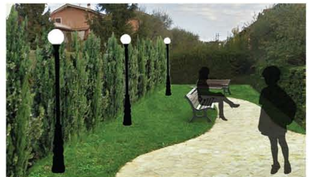
RIUTILIZZO DI UNA STRADA CHIUSA COME SPAZIO PUBBLICO