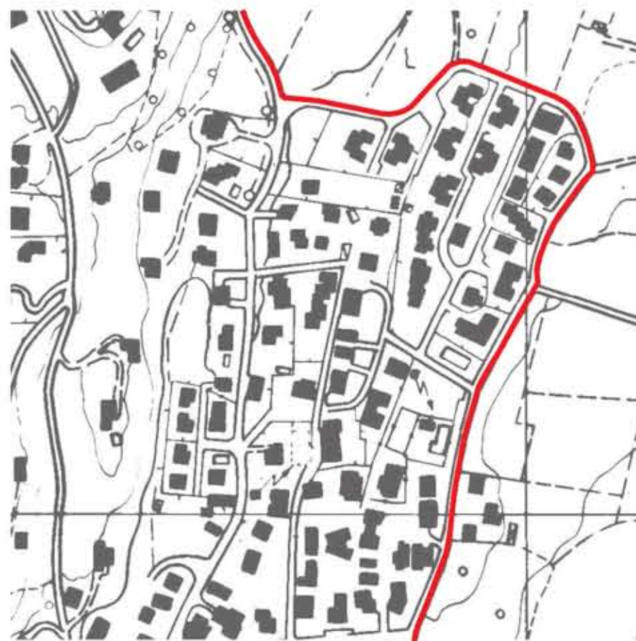
PISTA CICLABILE DI QUARTIERE