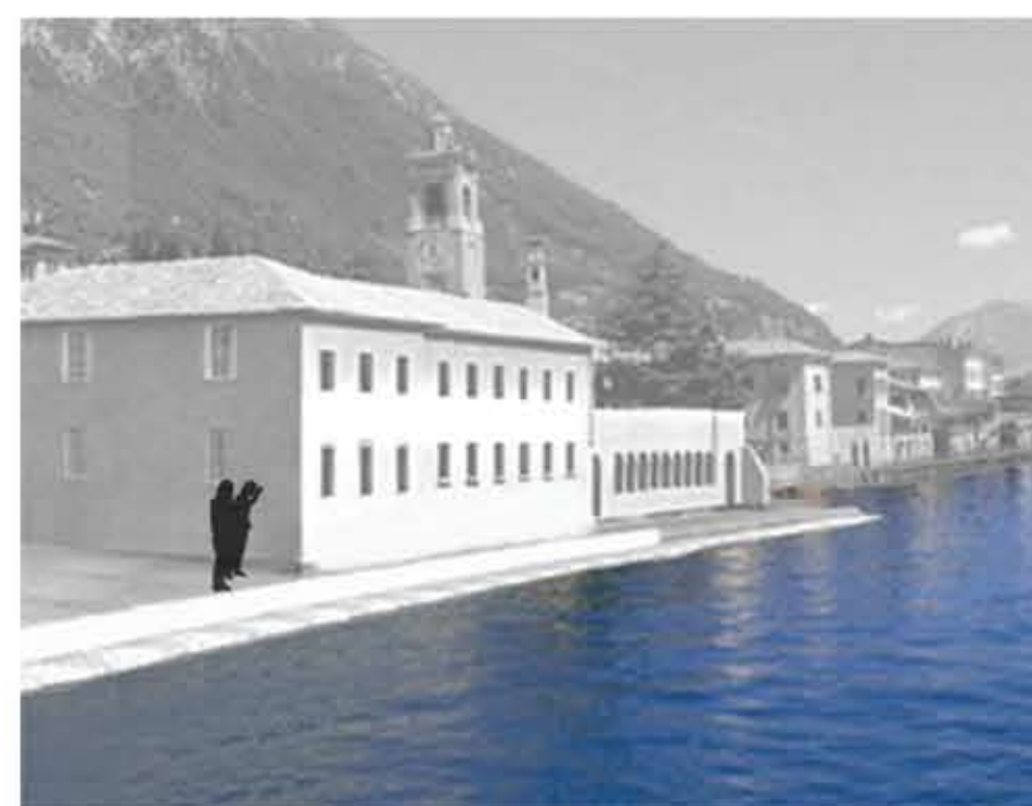
IL MUSEO E IL SUO RAPPORTO CON IL LAGO