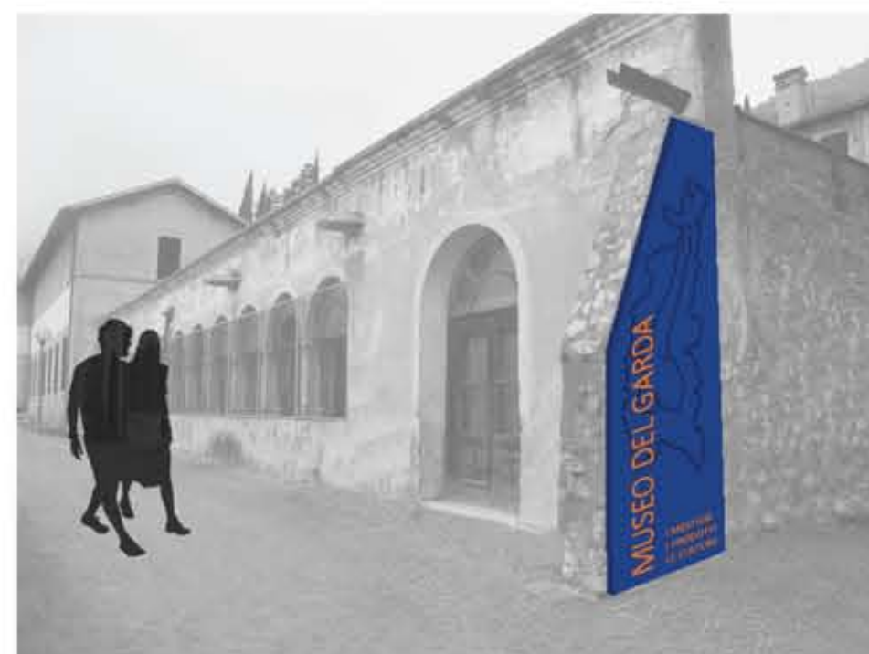
INGRESSO AL MUSEO

RIUSO DELL'EX OLEIFICIO E DEL CONVENTO FRANCESCO DI GARGNANO, IN DISUSO DAL 1968, COME NUOVO POLO MUSEALE DEL SISTEMA GARDA COMPRENDE ASPETTI RIGUARDANTI I MESTIERI TIPICI DEL GARDA, I PRODOTTI TRADIZIONALI DEL LAGO E LE DIVERSE CULTURE DELLE CIVILTÀ CHE HANNO ABITATO IL TERRITORIO.