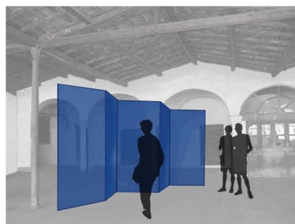
INTERNO RIUTILIZZATO COME SPAZIO ESPOSITIVO