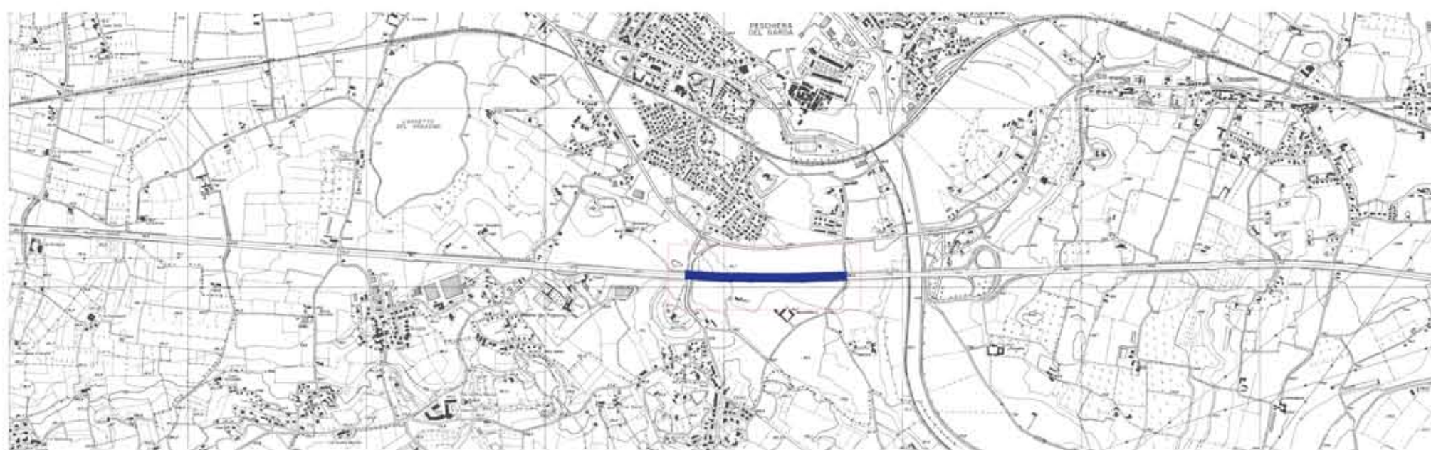
INQUADRAMENTO DELLA PARETE LUNGO IL TRATTO AUTOSTRADALE

LA PARETE METALLICA PRESENTA UNA FRATTURA; ALL'INTERNO DELLA QUALE SCORRE DELL'ACQUA CHE VUOLE SIMBOLEGGIARE IL GARDA.