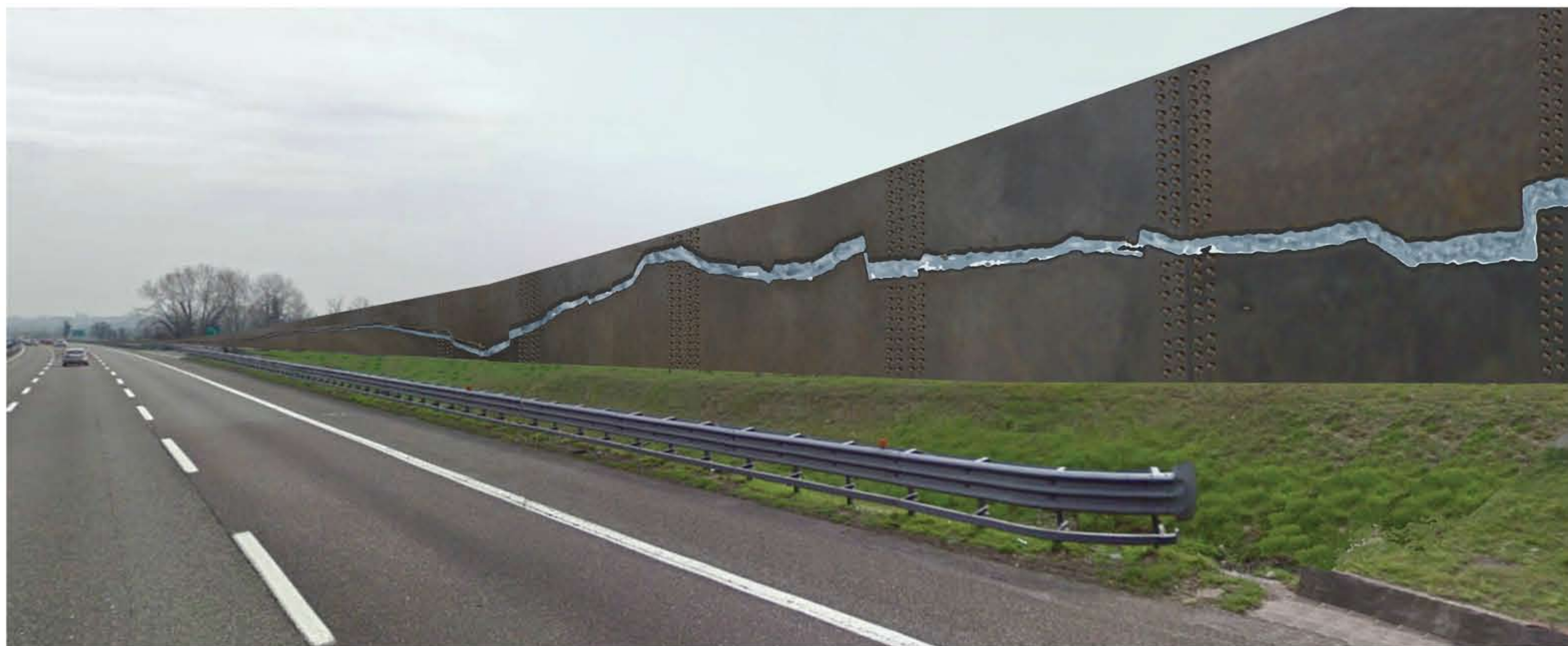
PARETE VISTA DALL'AUTOSTRADA IN DIREZIONE PESCHIERA