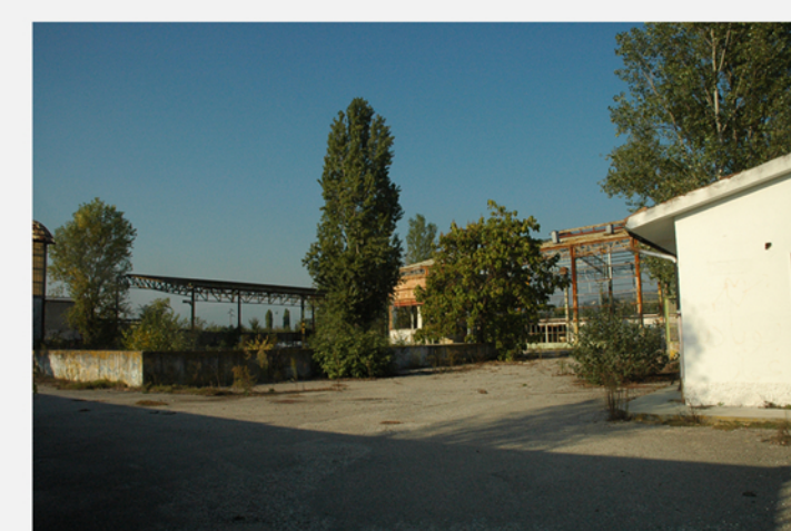
EDIFICI INDUSTRIALI ABBANDONATI