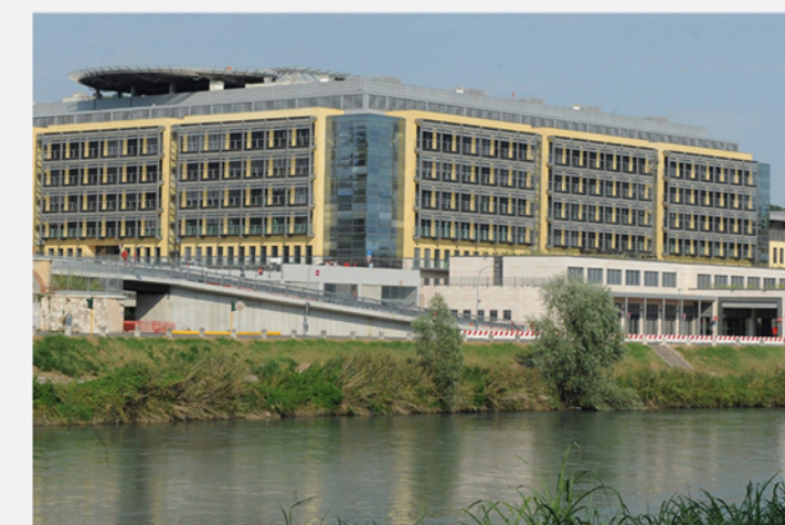
OSPEDALE BORGO TRENTO