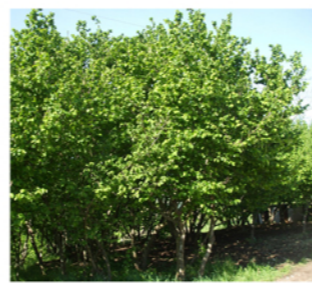
VISTA AREA A BOSCO CORTE MOLON - STATO DI FATTO