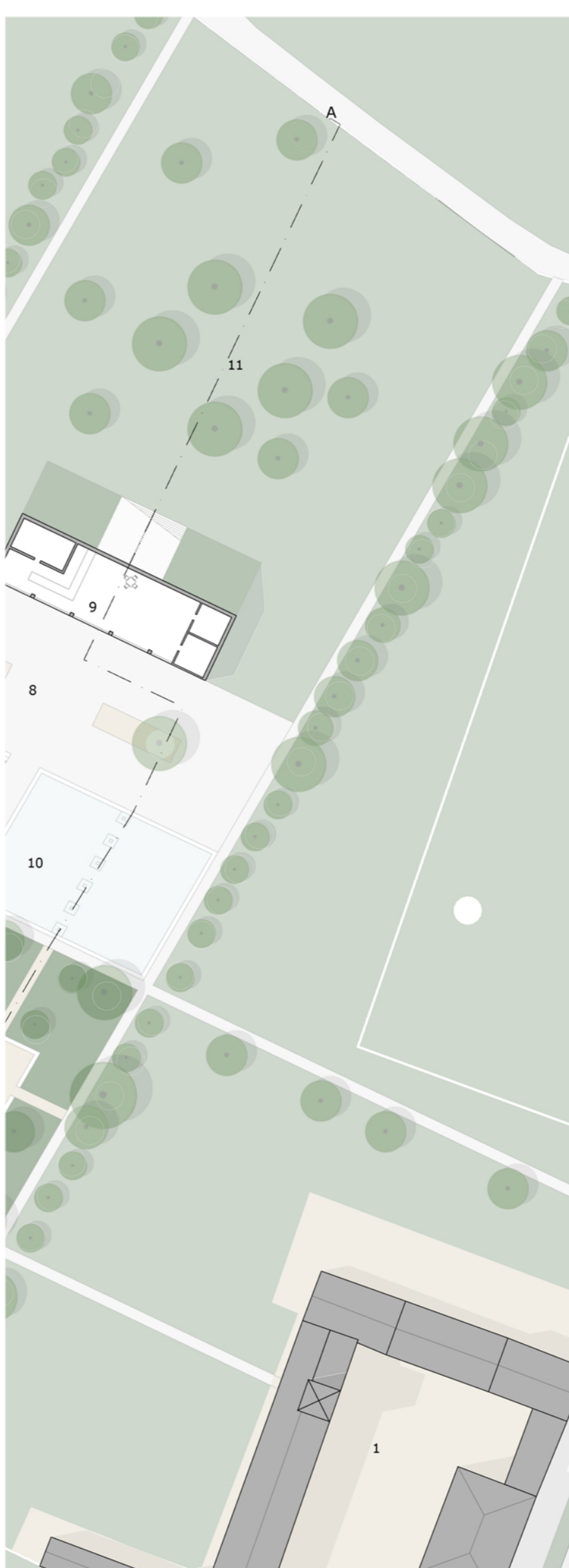
ZONA A VIALE ALBERATO FORMATO DALLE SPECIE VEGETALI COME OLMO CAMPESTRE E PIOPPO BIANCO