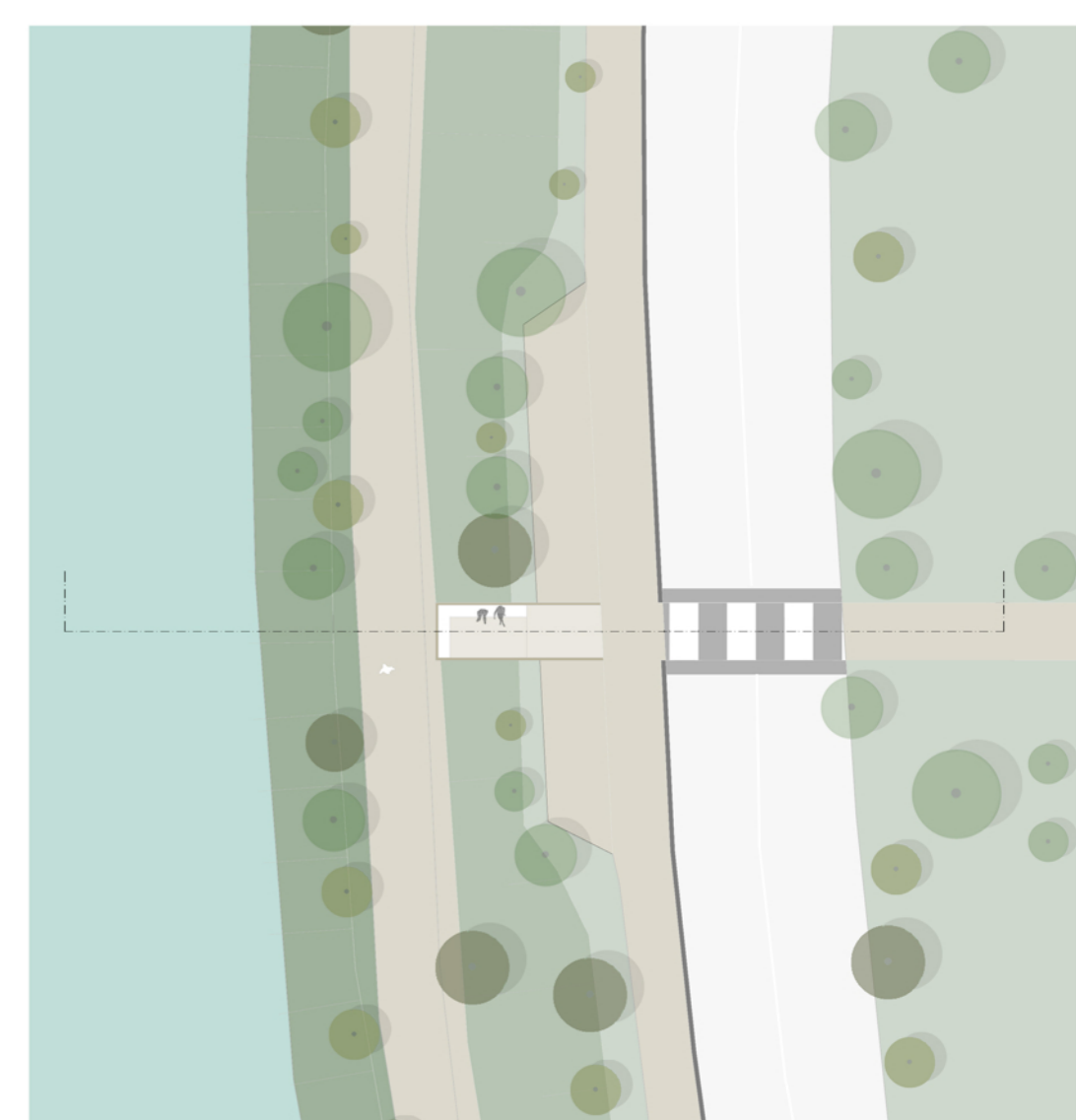
VEGETAZIONE RIPARIA FORMATA DA SPECIE COME OLMO CAMPESTRE, SALICE BIANCO, PIOPPO BIANCO.