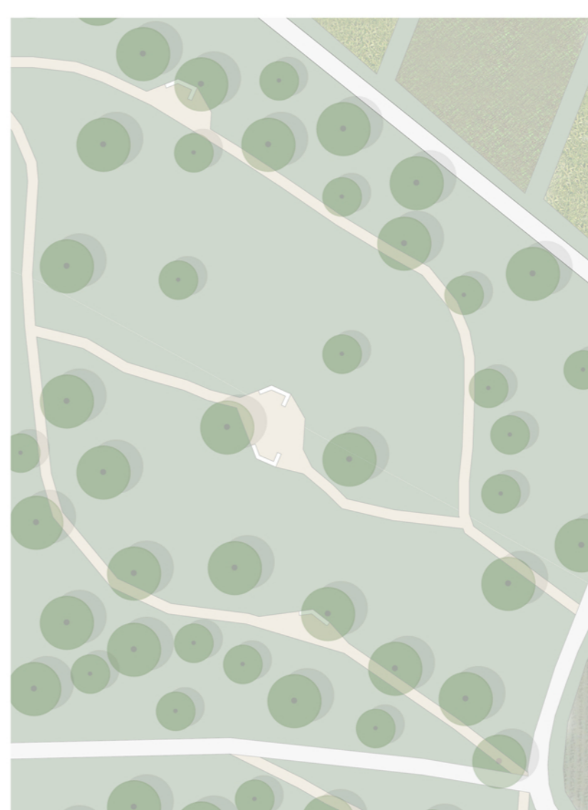
ZONA A BOSCO FORMATO DALLE SPECIE VEGETALI QUERCIA FARNIA E ACERO CAMPESTRE E DA ARBUSTI COME FRANGOLA E SANGUINELLA