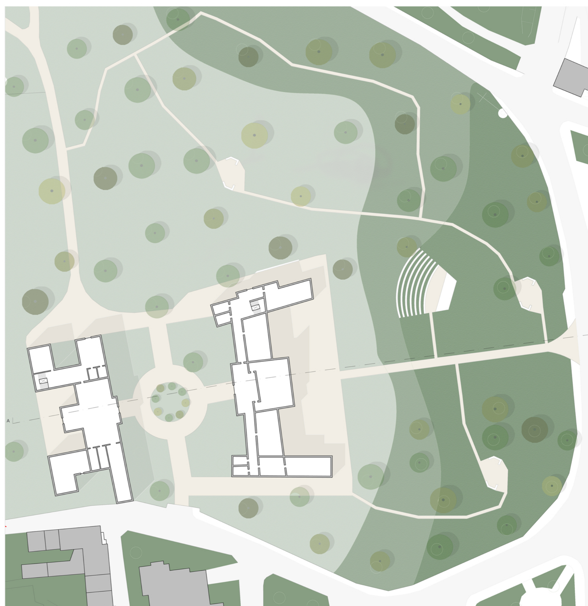
PARCO DI VILLA PULLÈ, CHIEVO, CON MOLTE SPECIE ARBOREE DI PREGIO E MONUMENTALI COME CEDRO DEODARA, CEDRO DEL LIBANO, QUERCIA