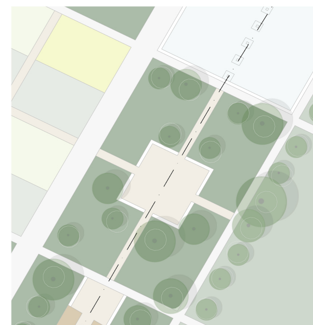
ZONA DELLA PIAZZA DELL'AREA DI CORTE MOLON CON SPECIE VEGETALI PIÙ ORNAMENTALI E MONUMENTALI COME OLMO CAMPESTRE, CARPINO BIANCO E FRASSINO MAGGIORE E DA ARBUSTI COME SAMBUCO E BIANCOSPINO