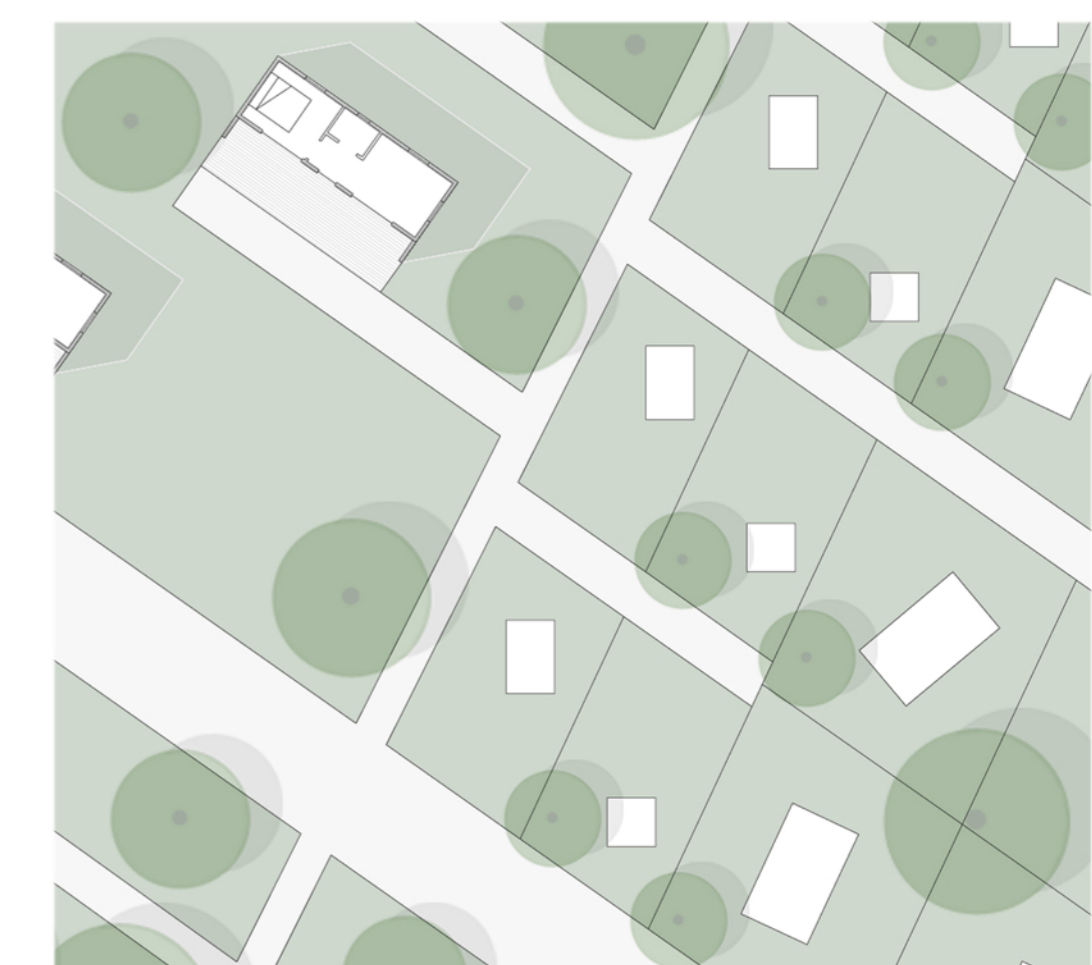
ZONA DELL'AREA DEL CAMPEGGIO FORMATA DALLE SPECIE VEGETALI QUERCIA FARNIA E CARPINO BIANCO E DA ARBUSTI COME NOCCIOLO E BIANCOSPINO E SAMBUCO