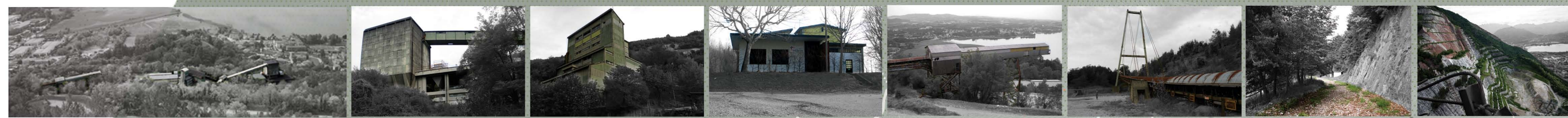
A_Vista Panoramica Edificio 1 Stazione di carico teleferica Edificio 2 Frantumazione primaria Edificio 3 Uffici Edificio 4 Nastro trasportatore 5 Ponte e nastro trasportatore Sentiero ciclo-pedonale B. Vista panoramica Cava Rossa