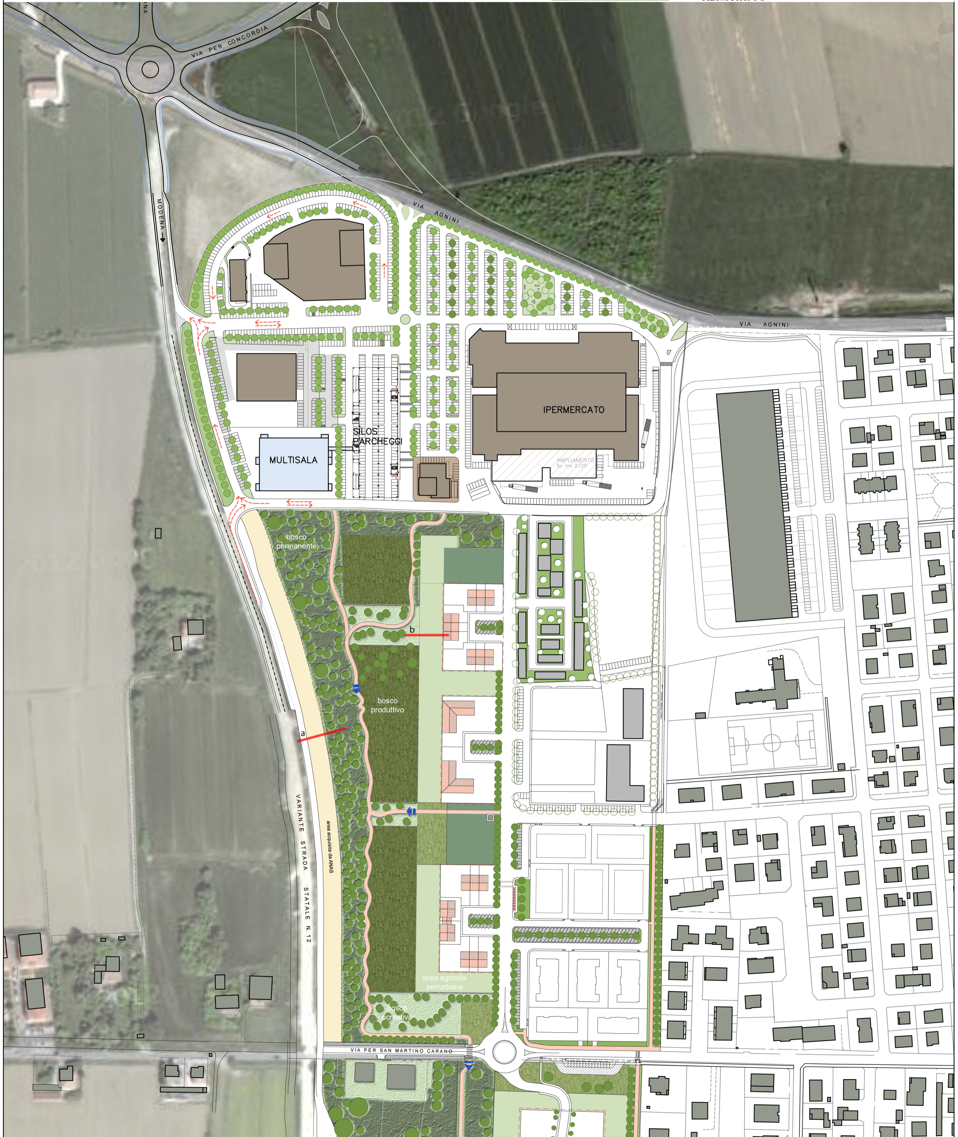
Sezione Bosco b-b