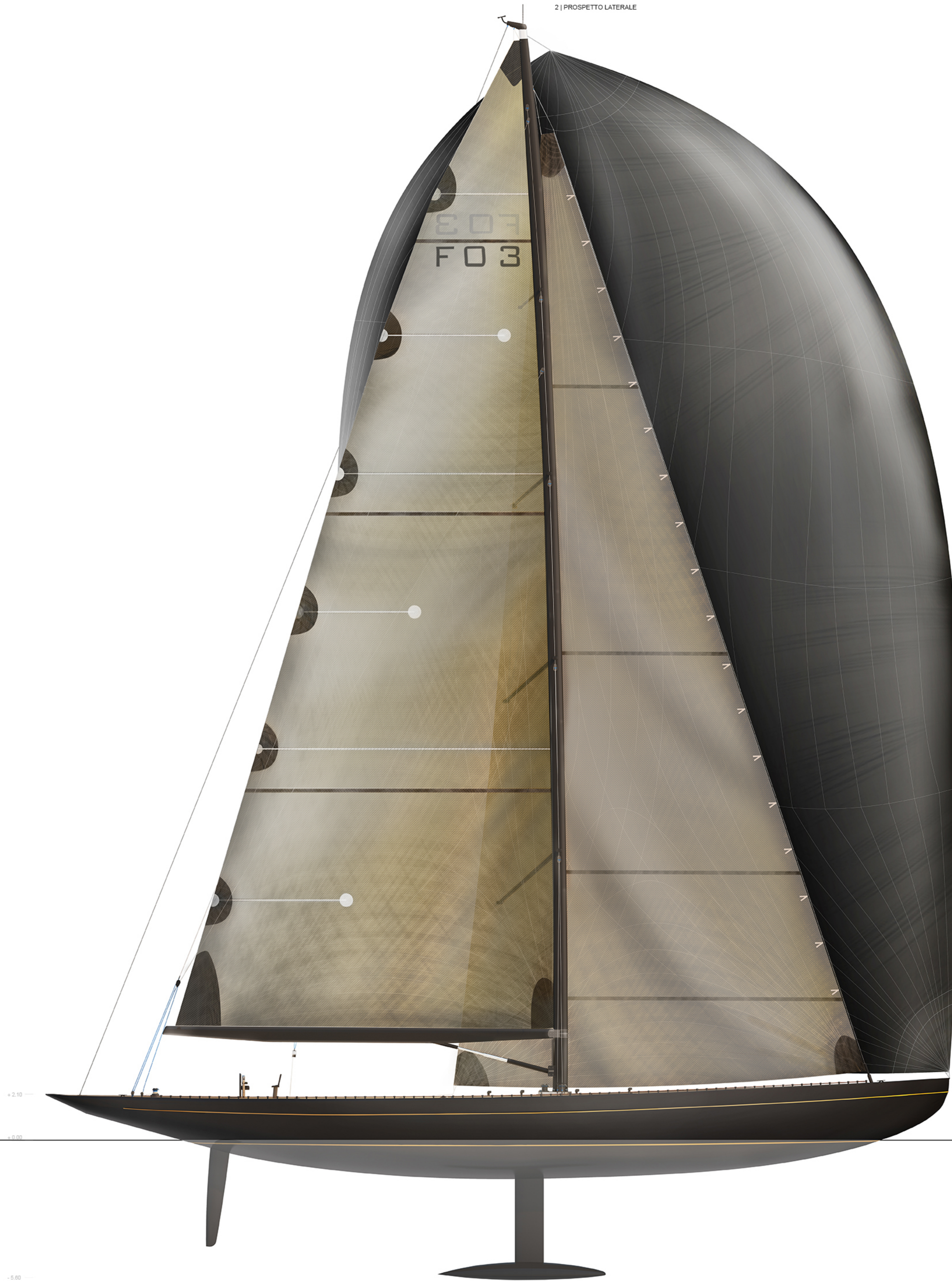
2 | PROSPETTO LATERALE