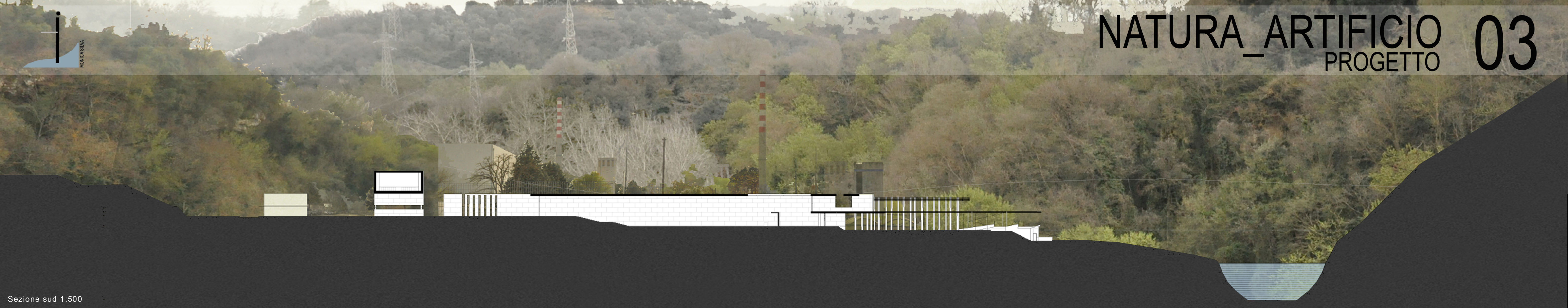
Sezione sud 1:500