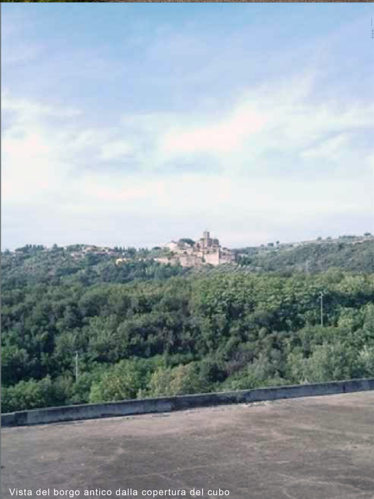
Vista del borgo antico dalla copertura del cubo