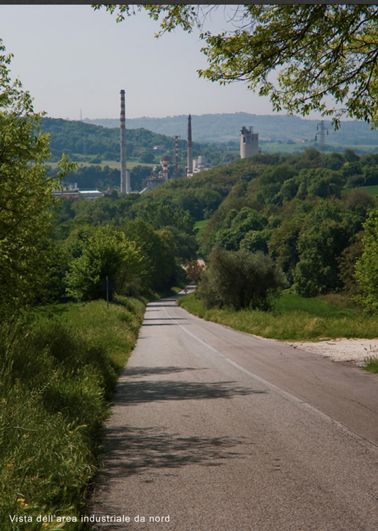
Vista dell'area industriale da nord