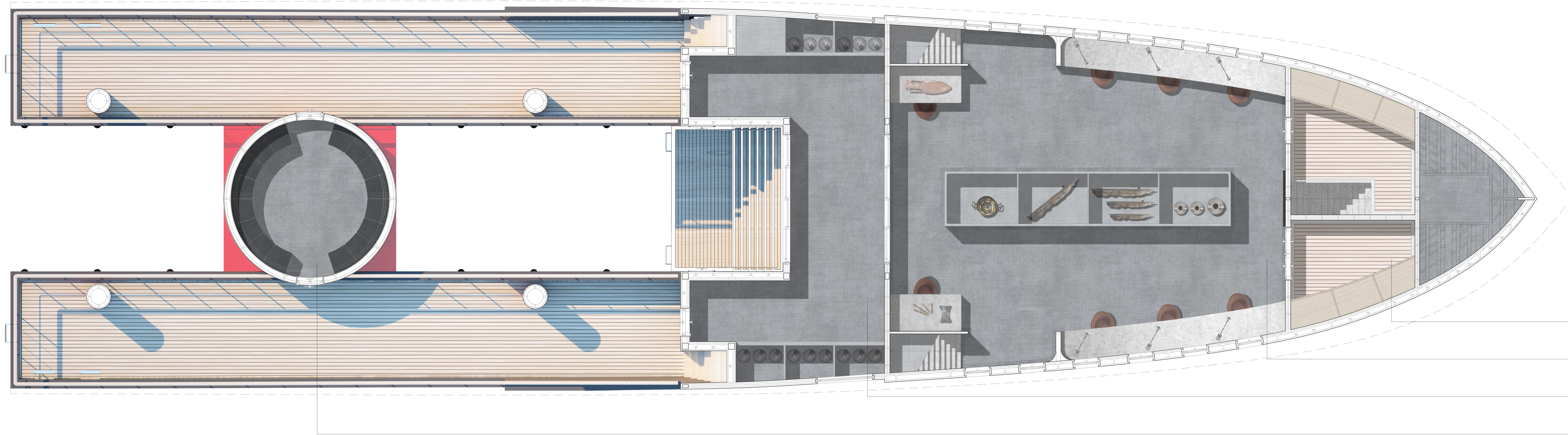
Pianta main deck