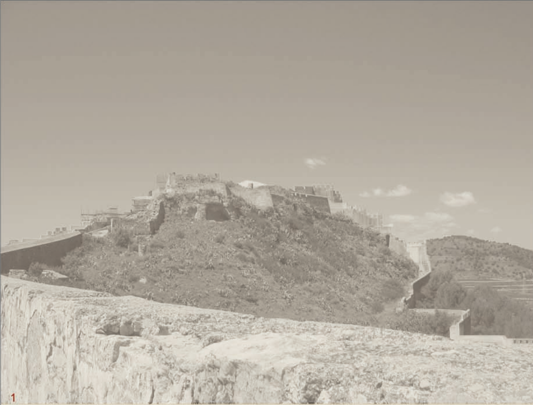
1 SEZIONE NORD