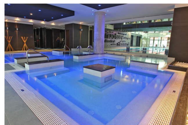
VILLAGGIO FITNESS VIRGIN ACTIVE BRESCIA FRECCIA ROSSA