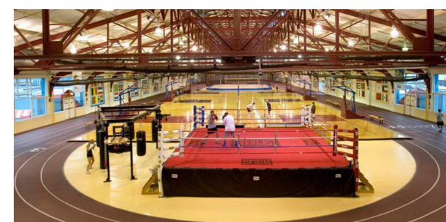
CHELSEA PIERS SPORTS AND ENTERTAINMENT CENTER - NEW YORK (STATI UNITI)