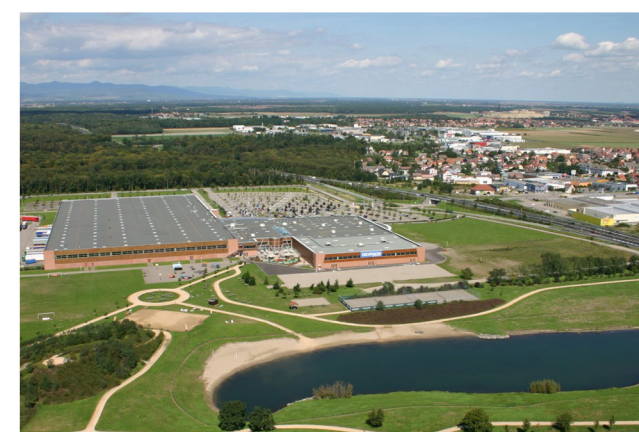
VILLAGGIO OXYLANE WITTENHEIM - MULHOUSE (FRANCIA)

POLITECNICO DI MILANO Scuola di Architettura e Società