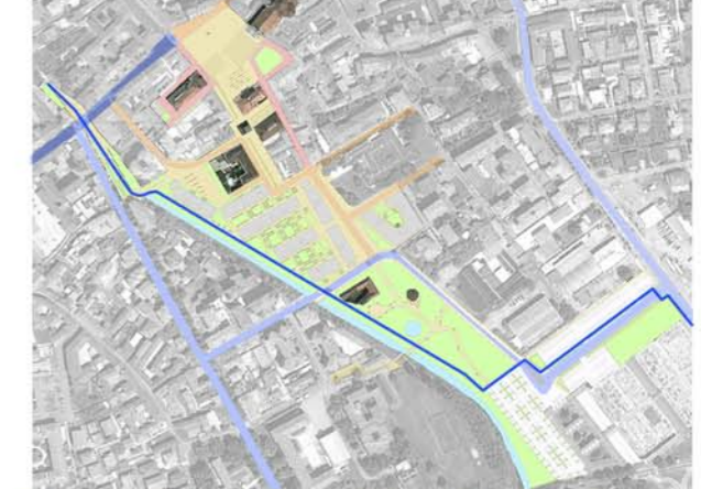
■ Area pedonale ■ Zona a traffico limitato (ZTL) ■ Zona 30 ■ Ciclopedonale ■ Strada normale