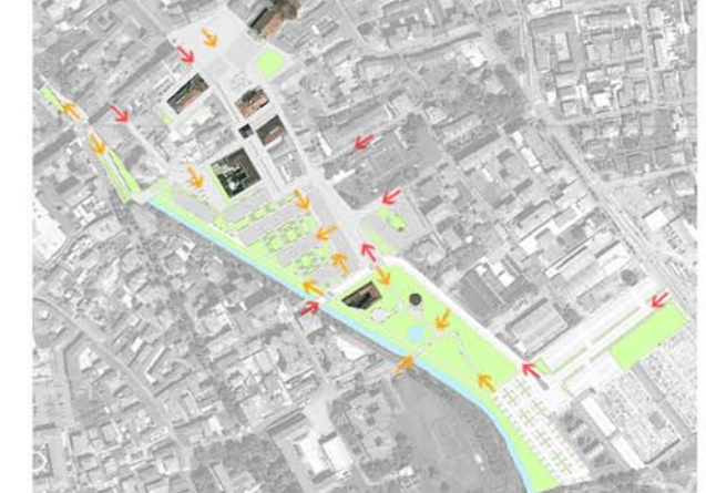
→ Accessi pedonali alle aree progettuali → Accessi carrabili alle aree progettuali