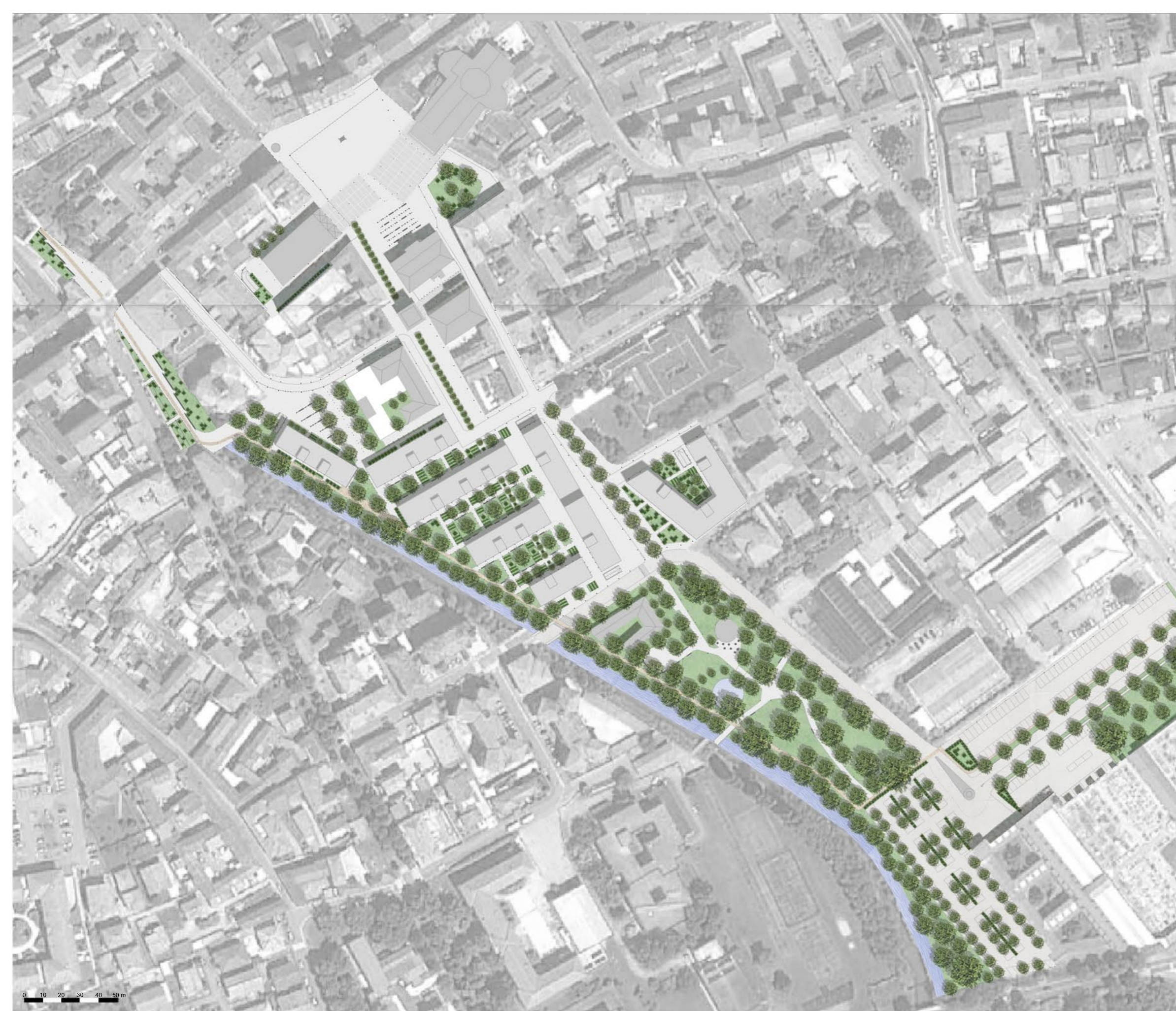
LOCALIZZAZIONE DEL NUOVO COMPARTO RESIDENZIALE E COMMERCIALE