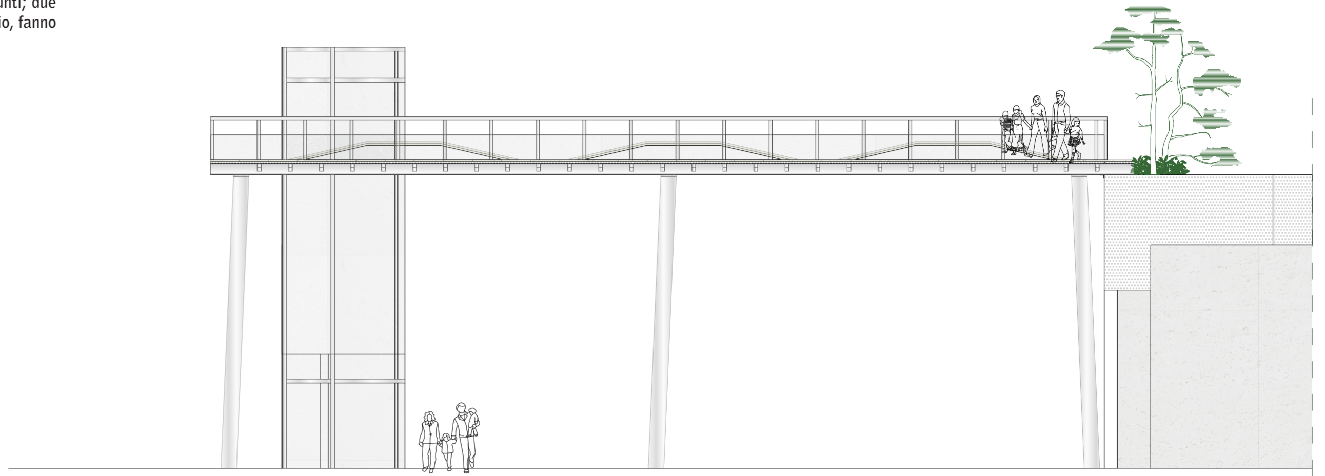
SEZIONE TRASVERSALE scala 1:100

La passerella per l'attraversamento in quota della strada non resta solo un ponte ma ha l'obiettivo di diventare un vero e proprio spazio pubblico. Si attrezza con panchine, integrate alla pavimentazione, che si alzano sinuosamente, il parapetto è un vetro anticaduta che consente la vista sulla strada, luogo di "happening", anche da seduti. È sostenuto da una struttura in acciaio, dei pilastri composti, a sezione circolare cava, lo sostengono in tre punti; due travi scatolari a sezione rettangolare alle quali sono saldate delle ali, il tutto in acciaio, fanno da base per la posa del pavimento in legno.