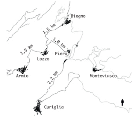
Distanza dei borghi limitrofi all'area dei mulini.