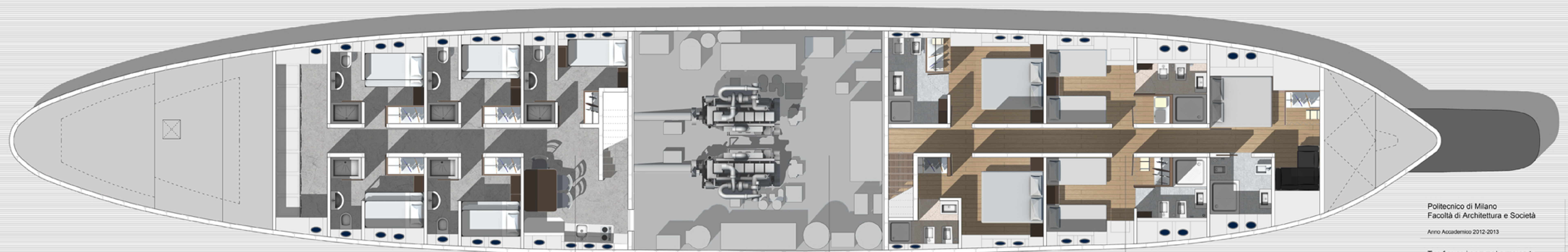
PONTE INFERIORE SCALA 1:50