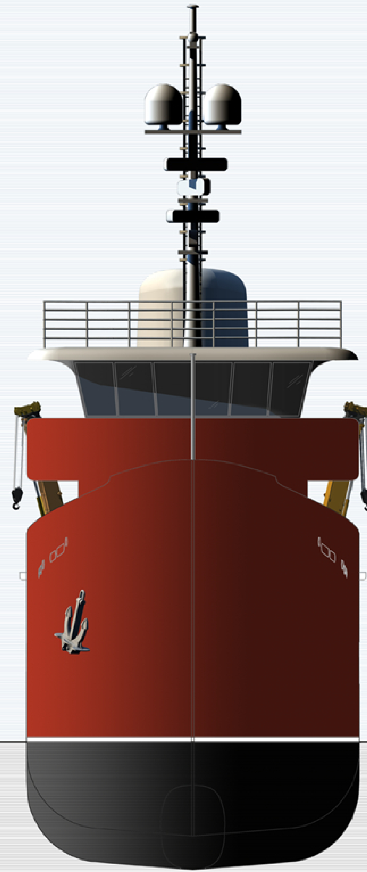
PROSPETTO PRUA SCALA 1:50