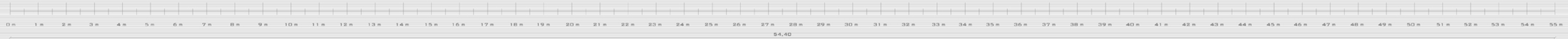
PROSPETTO LATERALE SCALA 1:50