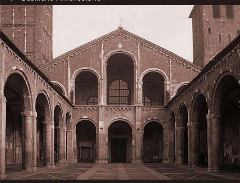
▼ Basiliche Ambrosiane