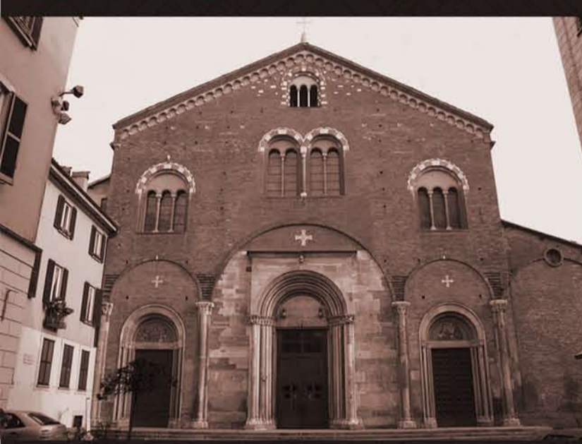
▼ Basiliche Paleocristiane