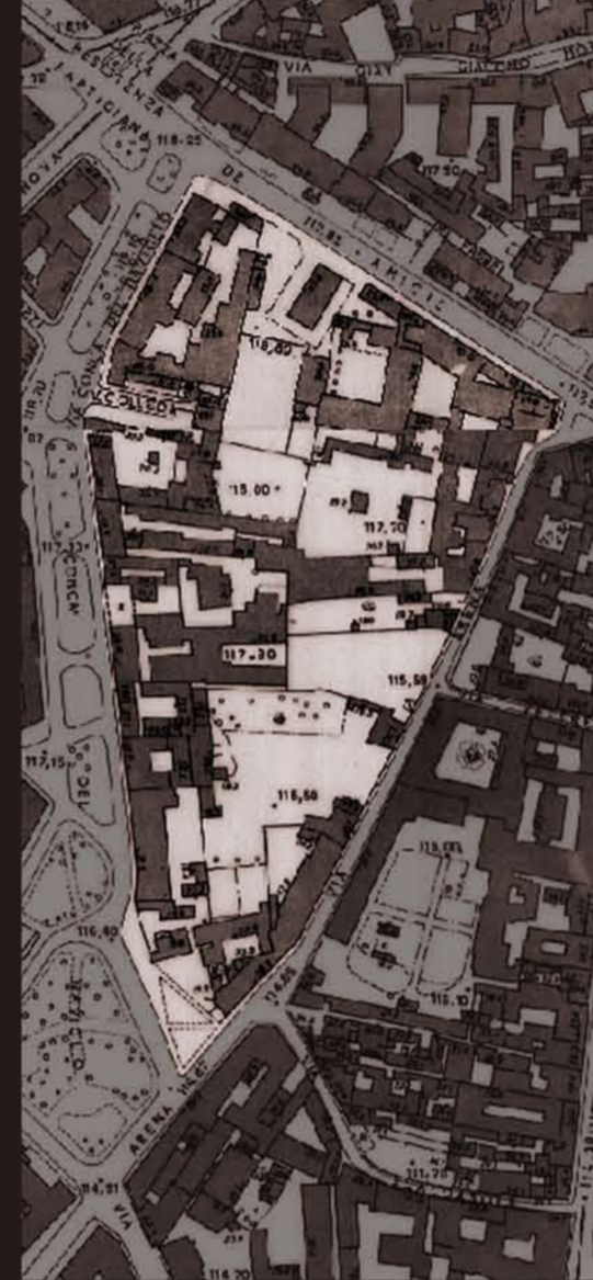
Carta Tecnica Comunale, 1965