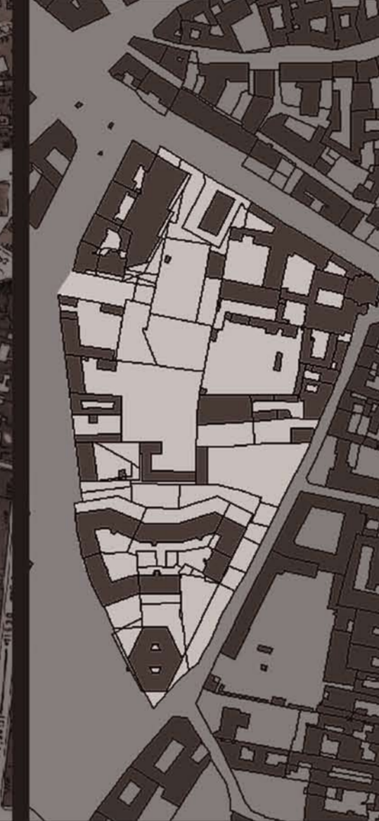
Carta Tecnica Comunale, 2006