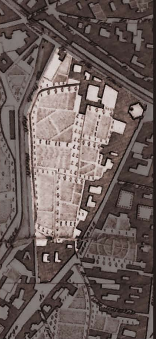
Domenico Manzoni, 1844