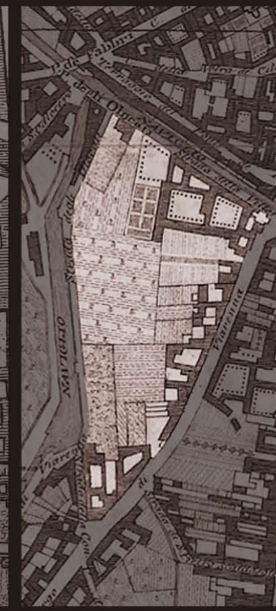
Giacomo Pinchetti, 1801