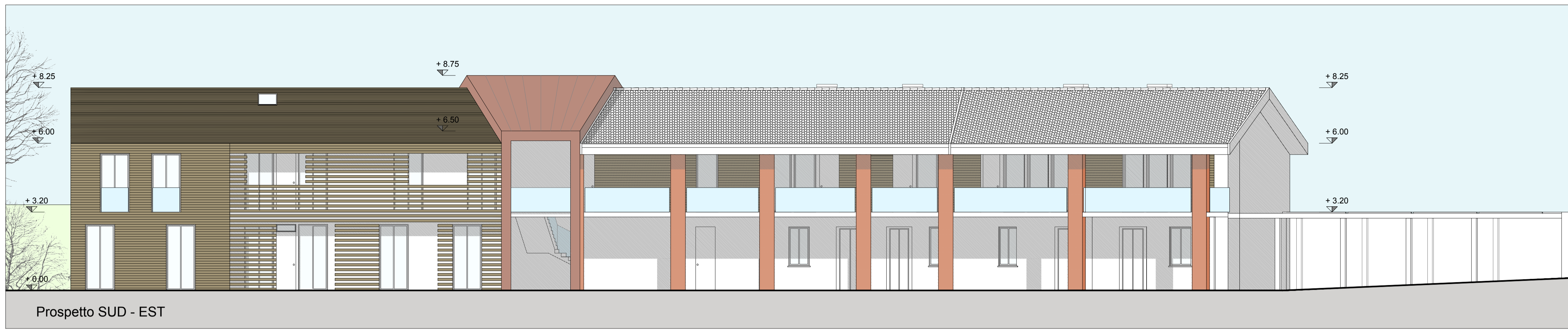
Prospetto SUD - EST